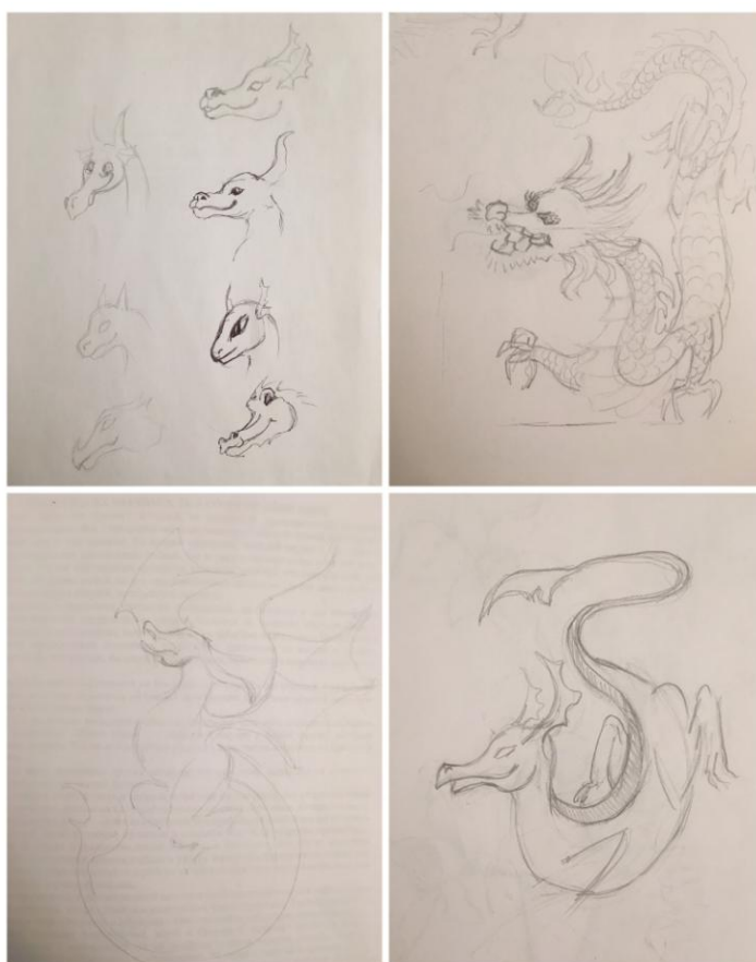
Рисунок 2. Этап эскизирования «Хранители очага»

«Хранители очага» ДПИп-1501 Алексаян К.К. 2019г. .