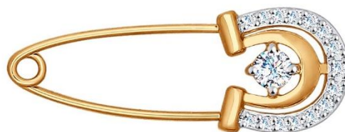
Рисунок 9. Брошь-булавка «Sokolov»