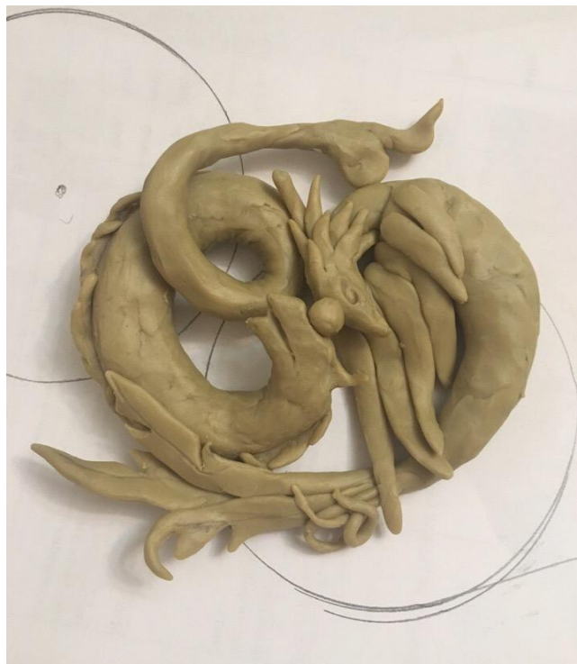
Рисунок 4. Этап макетирования «Хранители очага» ДПИп-1501 Алексанян К.К. 2019г.