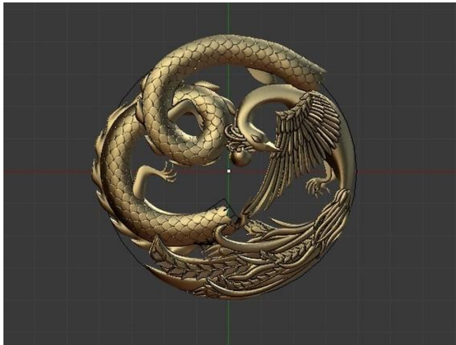
Рисунок 6. Этап моделирования «Хранители очага» в «blender»