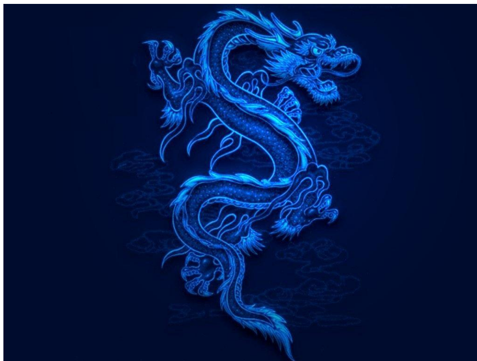
Рисунок 3. Синий дракон