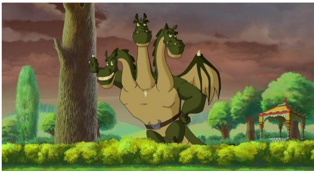
Рисунок 4. «Змей Горыныч» иллюстрация из мультфильма «Алёша Попович и Тугарин змей»