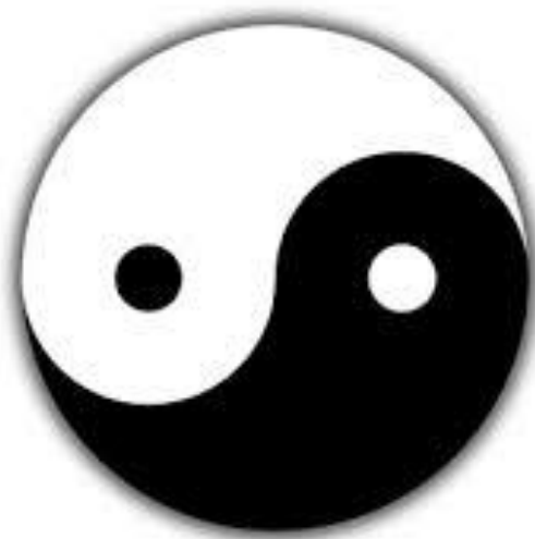
Рисунок 7. «Инь-Янь»