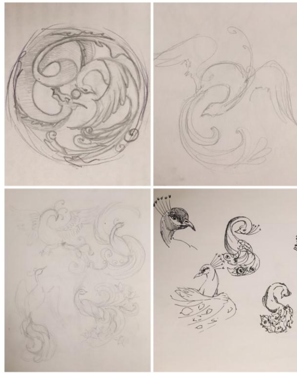
Рисунок 3. Этап эскизирования «Хранители очага» ДПИп-1501 Алексанян К.К. 2019г.