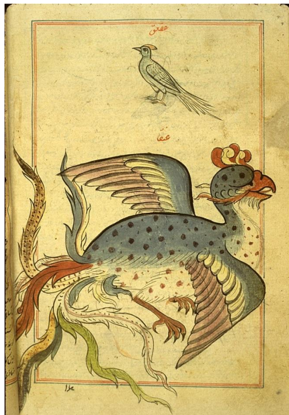
Рисунок 6. «Симург» (Анка)