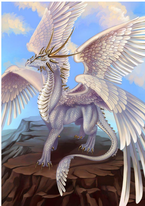
Рисунок 1. Белый дракон