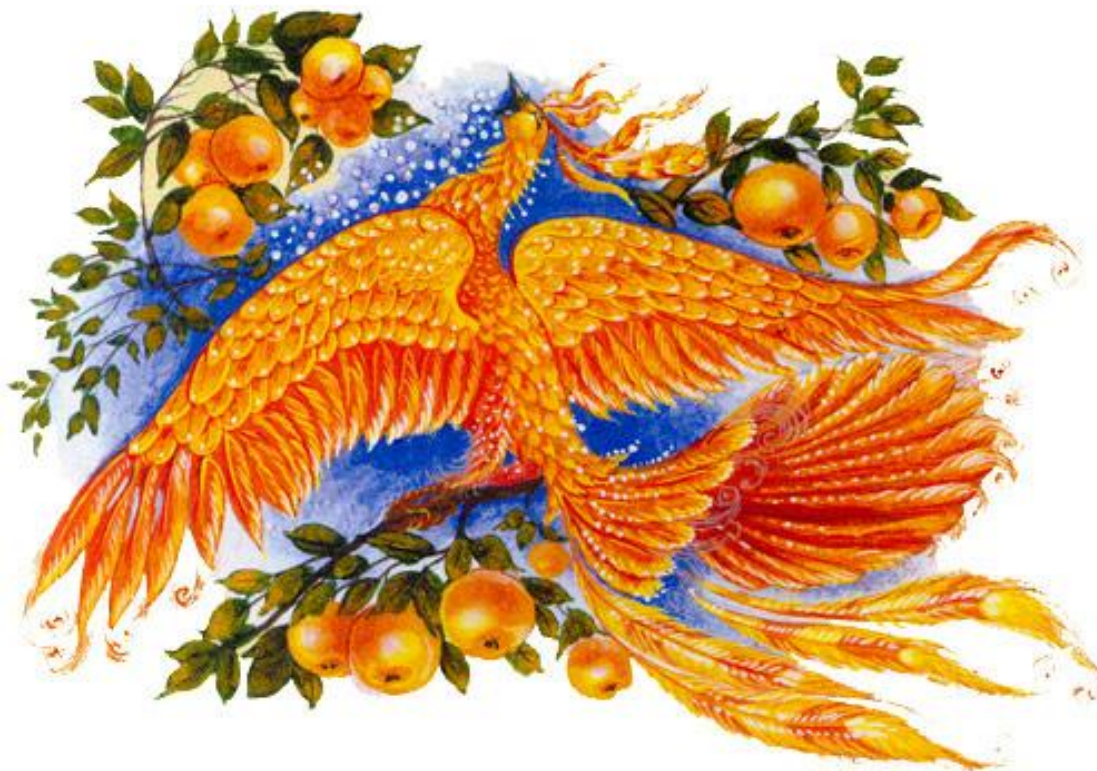
Рисунок 7. «Жар-птица»