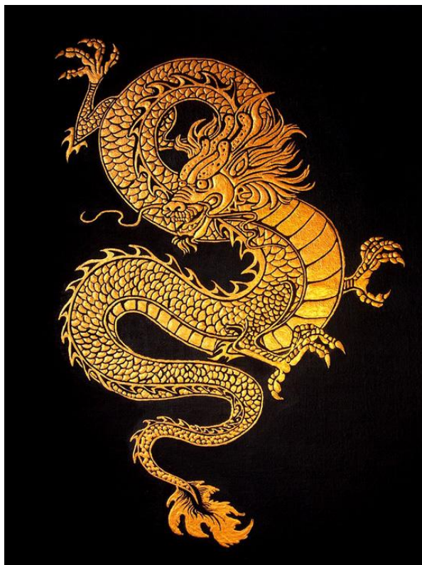
Рисунок 2. Китайский золотой дракон