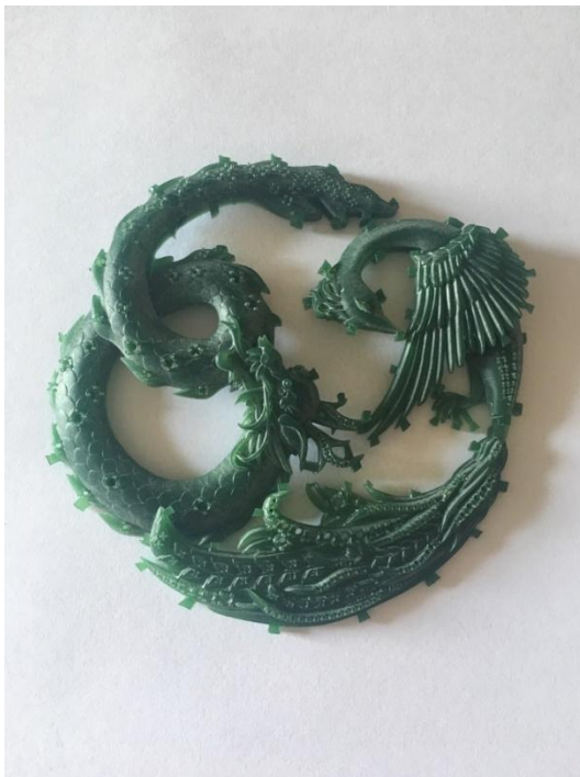
Рисунок 7. Восковая модель «Хранители очага» ДПИп-1501 Алексанян К.К. 2019г.