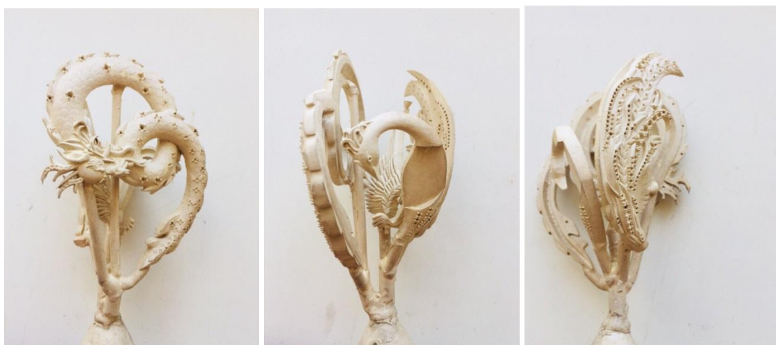
Рисунок 8. Изделия «Хранители очага» после литья ДПИп-1501 Алексанян К.К. 2019г.