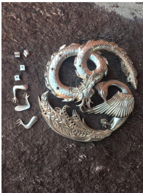
Рисунок 8. Изделия «Хранители очага» после удаления литников ДПИп-1501 Алексанян К.К. 2019г.