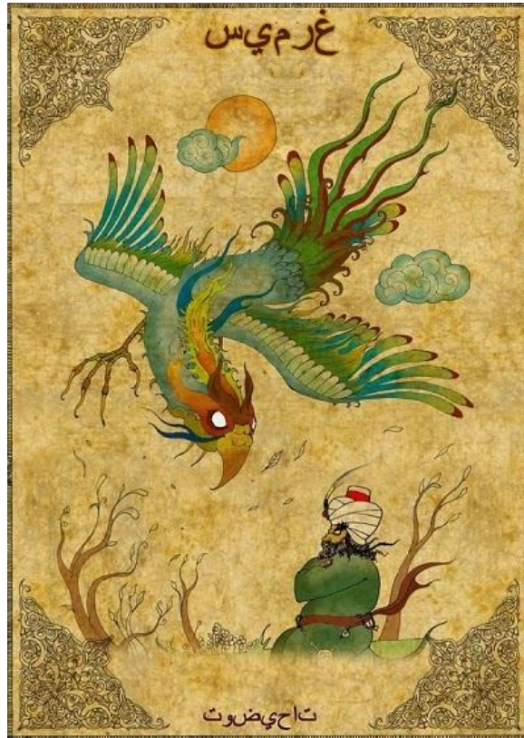
Рисунок 5. «Анка»