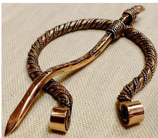
Рисунок 9. «Фибула»