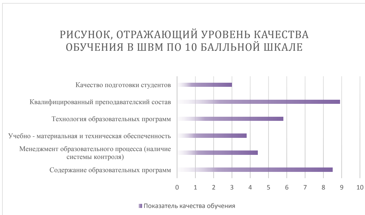
Рисунок 1 – Результаты исследования уровня качества обучения подготовки водителей по 10-балльной шкале

вывод, что существующая программа является недостаточно эффективной программой при подготовке будущих водителей.