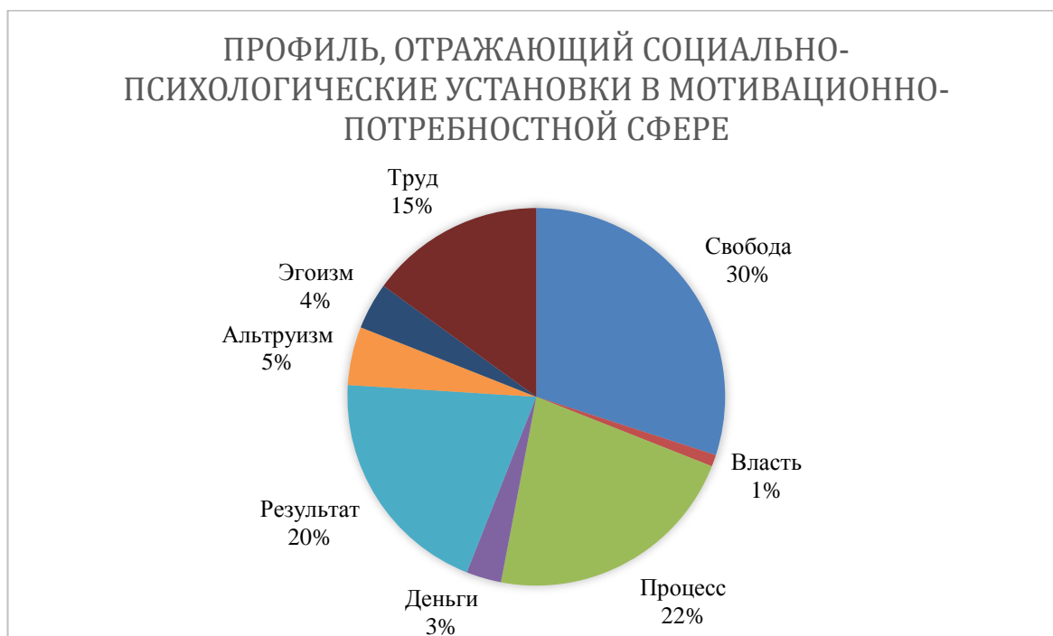
Рисунок 3 – Профиль, отражающий социально-психологические установки в мотивационно-потребностной сфере после прохождения программы «Школа вожатского мастерства»

По результатам диагностики с помощью методики диагностики социально-психологических установок личности в мотивационно-потребностной сфере (О.Ф. Потемкиной) было выявлено следующее. Оказалось, что у студентов наблюдался высокий показатель по шкале «ориентация на свободу». Свобода являлась для них важным фактором, они с трудом переносили ограничения, часто готовы были идти ради своей независимости идти на жертвы. Им сложно подчиняться, держать дисциплину, организовывать себя. Из-за этого у них часто могут возникать конфликтные ситуации в профессиональной деятельности, связанные с ограничением личного пространства, свободного высказывания своего мнения, поведения и т.д. Профиль, отражающий социально-психологические установки в мотивационно-потребностной сфере представлен на рисунке 3.