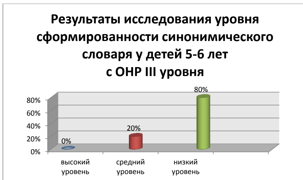
Рисунок 1 – Результаты сформированности синонимического словаря у детей 5-6 лет с ОНР III уровня на констатирующем этапе

Результаты исследования сформированности синонимического словаря у детей 5-6 лет с ОНР III уровня по всем диагностическим заданиям представлены на Рисунке 1. Протокол с результатами представлен в Приложении Ж.