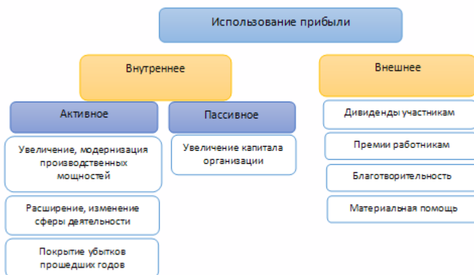
Рис. 3 – Использование прибыли

Использование прибыли можно представить в схематичном виде на рисунке 3: