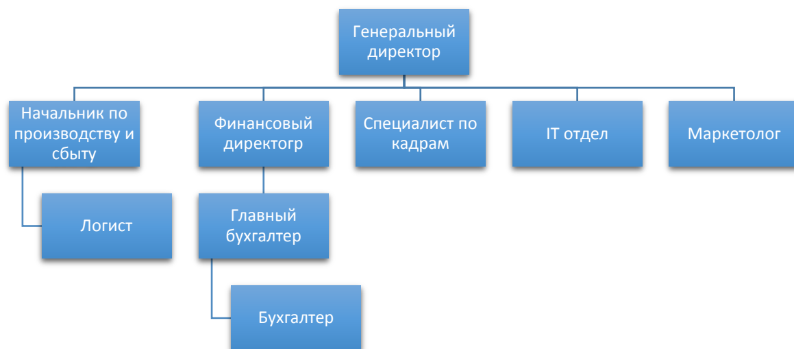
Рис.1 Организационная структура управления ООО «СТС»

Финансовый директор- второе по важности ответственное лицо, которое занимается контролированием затрат, а также оптимизирует налогообложение. В его подчинение входит бухгалтерия.