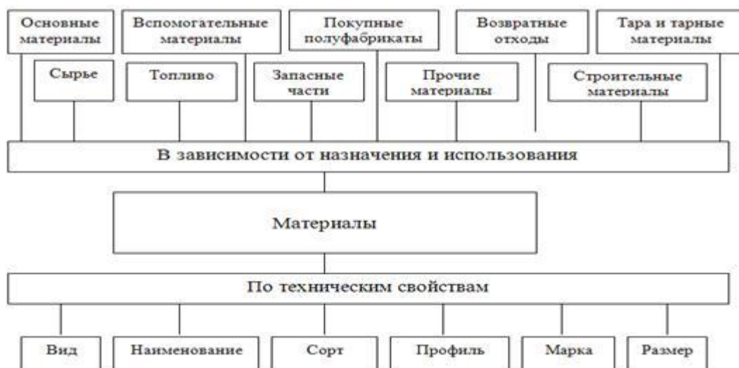
Рис.1. Классификация материалов по назначению и техническим свойствам

Так в качестве материальных запасов выступают предметы, применяемые в деятельности организаций не больше 12 месяце, без привязки к их стоимости [6].