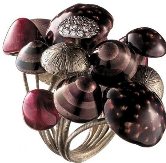
Рис.6 Кольцо по мотивам книги «Алиса в Стране чудес».