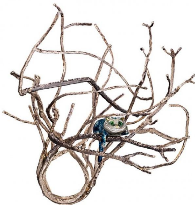
Рис.5 Кольцо по мотивам книги «Алиса в Стране чудес».