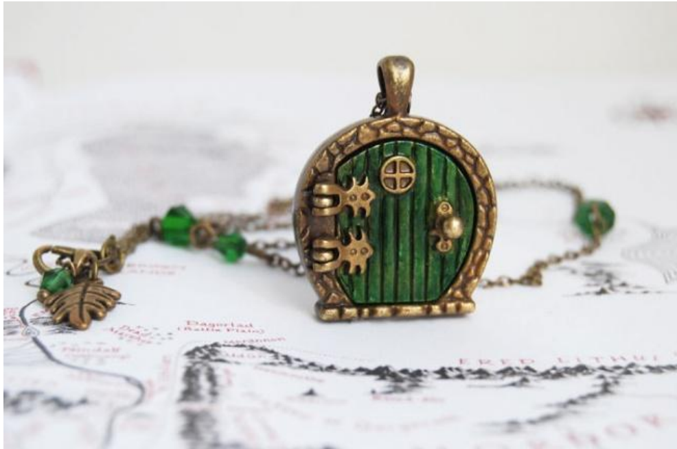
Рис.1 Подвес по мотивам книги Джона Рональда Руэла Толкина «Властелин колец».