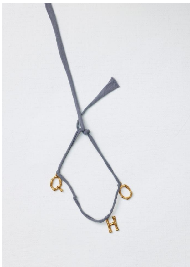
Рис.7 Коллекция Alphabet.