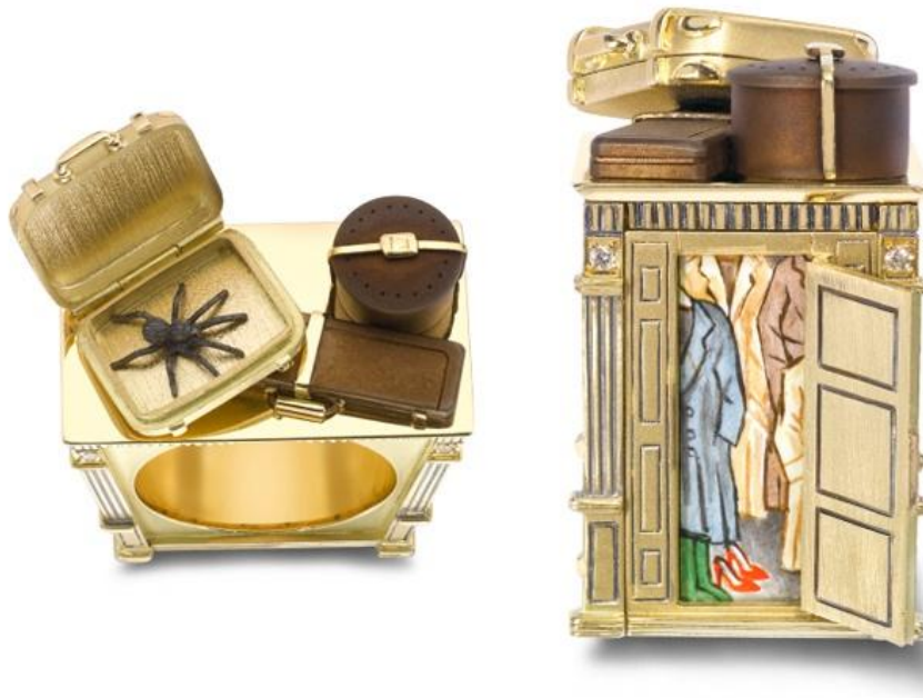
Рис.3 Кольцо по книге Клайва Стэйплза Льюиса «Хроники Нарнии».