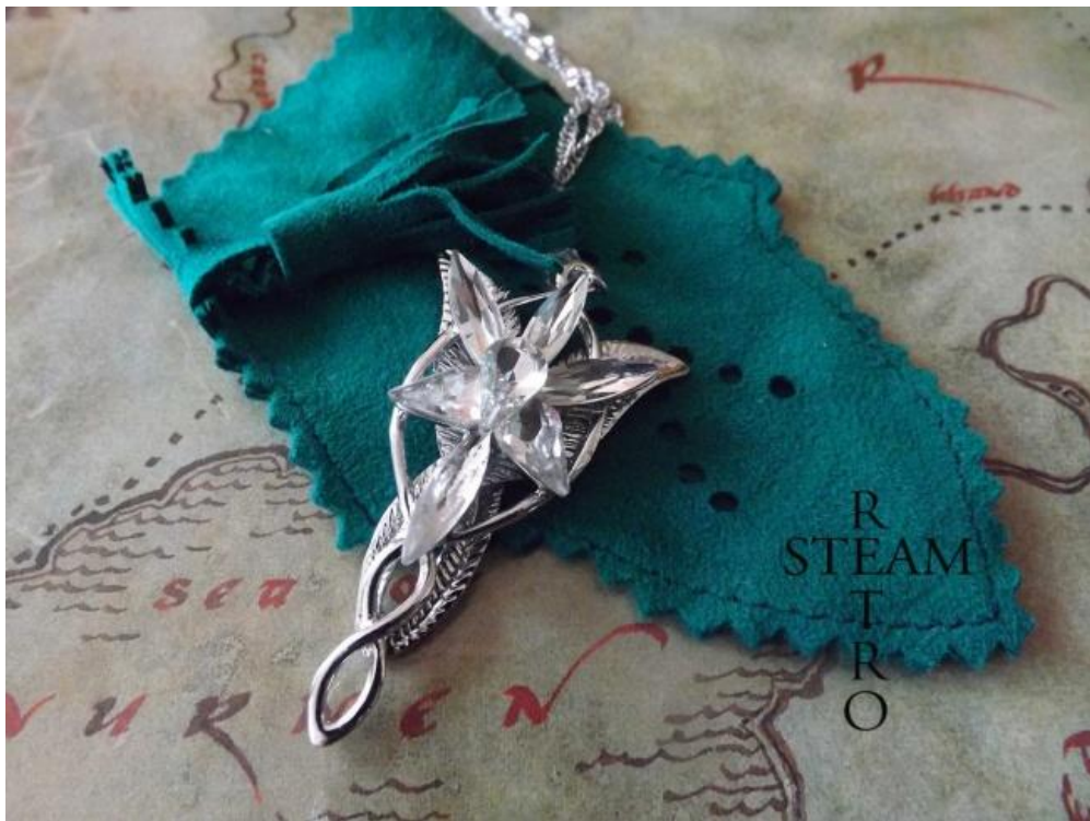
Рис.2 Подвес «Свет вечерней звезды» из книги «Властелин колец».