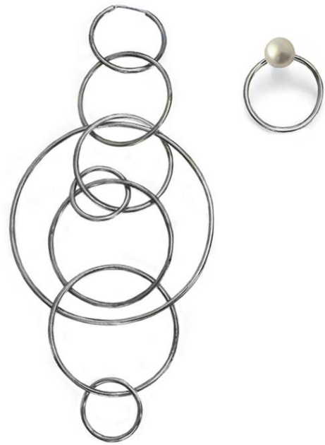
Рис.14 VoDa Jewel.