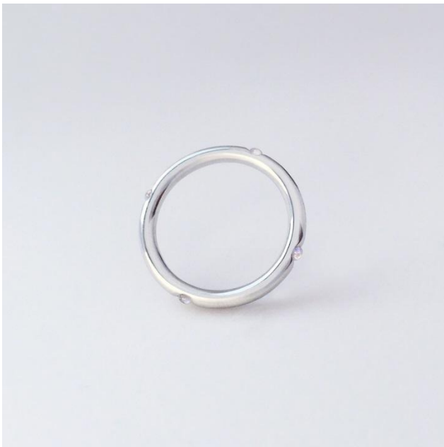
Рис.15 Anima Jewels.