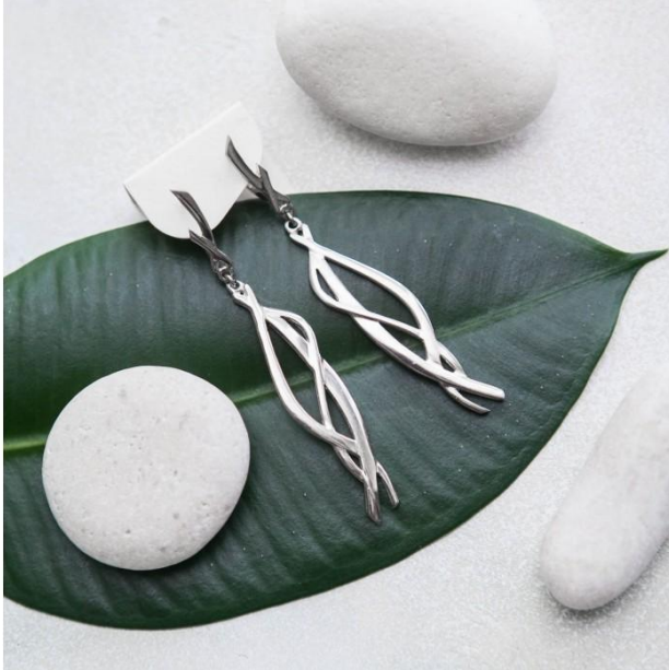
Рис.13 Серьги Вагановой Софии.