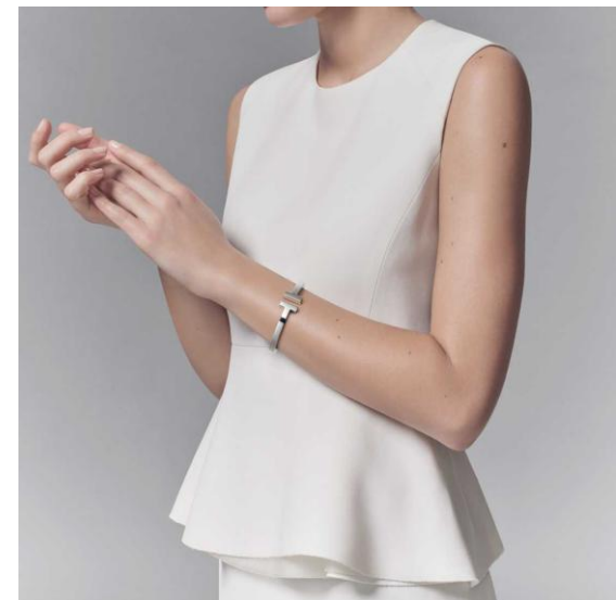
Рис.12 Браслет Tiffany T Square.