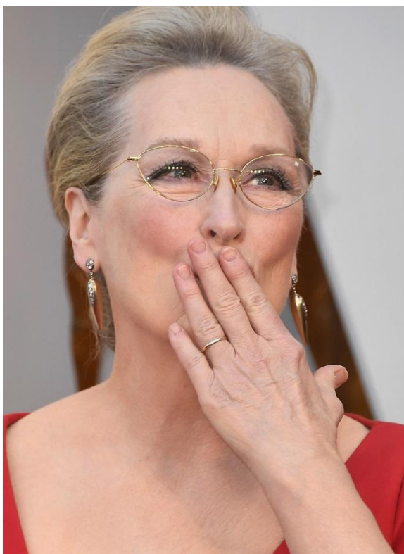
Рис.8 Серьги Fred Leighton.