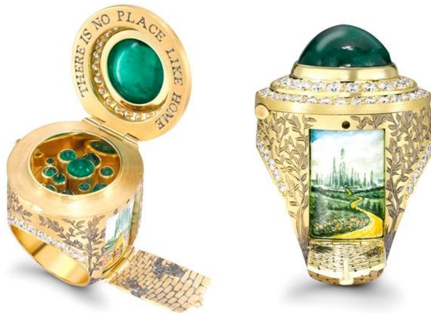
Рис.4 Кольцо посвященное книге «Волшебнику из страны Оз».