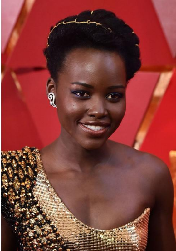
Рис.9 Люита нионго. Японская марка Niwaka.