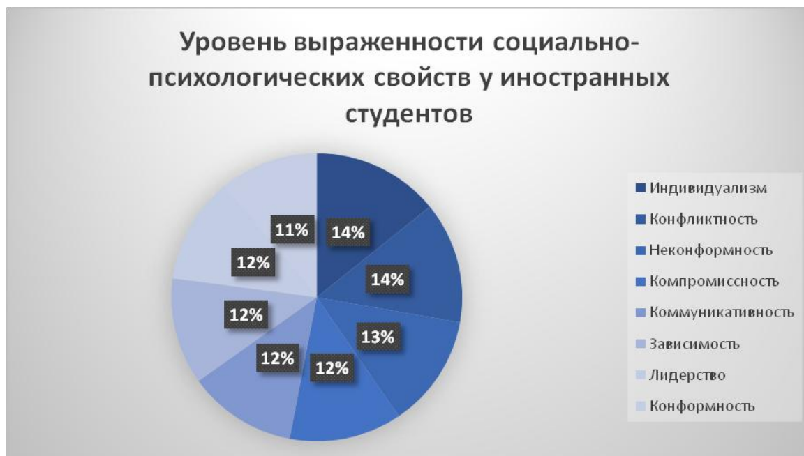
Рисунок 2 – Уровень выраженности социально-психологических свойств у иностранных студентов

Результаты таблицы 4 мы перевели в вид диаграммы для того, чтобы нагляднее продемонстрировать последовательность и проявление различных психологических и социальных свойств у иностранных студентов. Представим значение каждого социально-психологического свойства личности в виде процентного соотношения для упрощения восприятия.