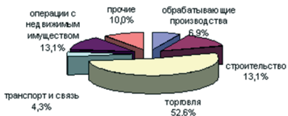
Рисунок 1 – Структура малого бизнеса по отраслям в Самарской области, 2012 г.

Нумерация иллюстраций должна быть сквозная по всей работе, арабскими цифрами: «Рисунок 1 – Структура малого бизнеса по отраслям в Самарской области, 2012 г.» Тематический заголовок располагают под рисунком без абзачного отступа и пишут с прописной буквы без точки в конце.