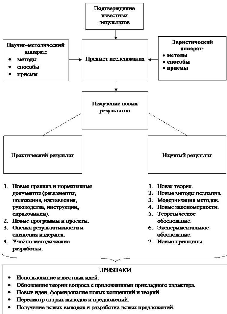
Рис. 4. Содержание результатов диссертационного исследования

и предложений, а также получение новых выводов и разработка новых предложений.