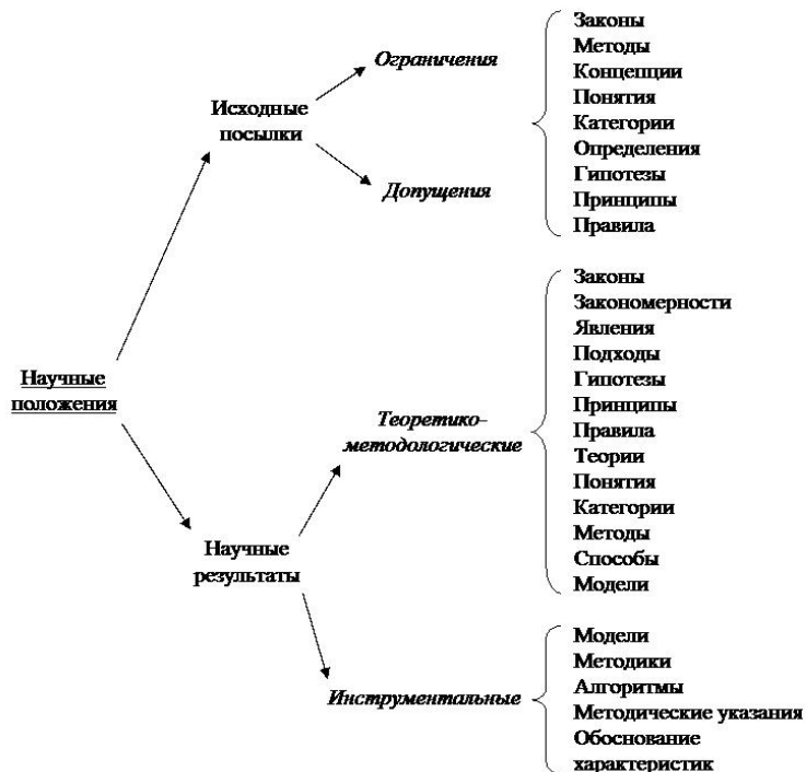
Рис. 3. Структура научных положений

концепцию, понятие, категорию, определения, гипотезу, принцип, правило, допущения, ограничения и т. п.