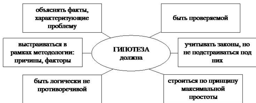
Рис. 1. Требования к построению гипотез

Гипотеза – это, прежде всего, предположение о наличии и характере связей между признаками, будь то каузальная, функциональная или еще какая-нибудь связь. Но в гипотезе не просто должна фиксироваться связь между двумя и большим числом признаков, в ней должен содержаться объясняющий компонент (рис. 1).