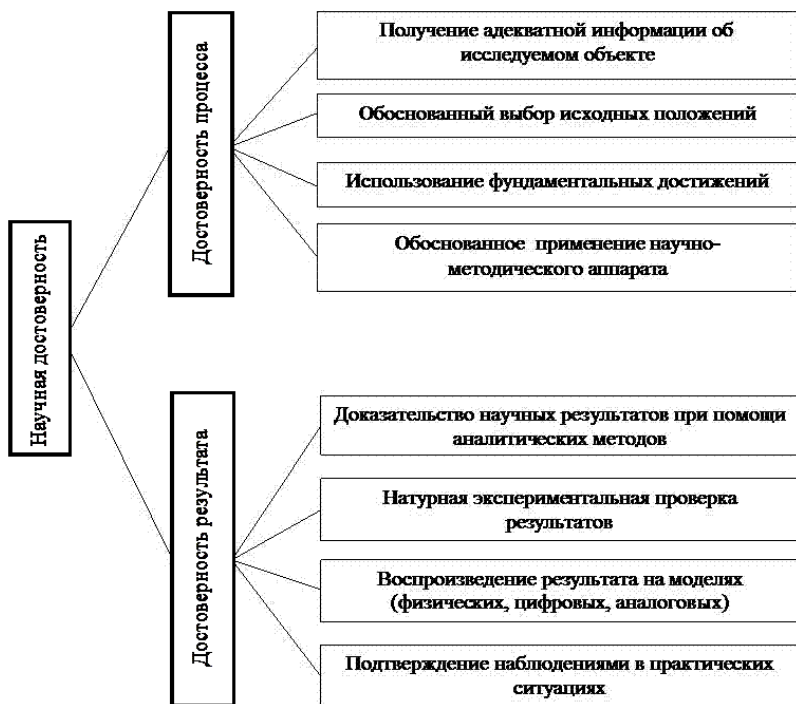
Рис. 5. Компоненты научной достоверности

Достоверность может быть подтверждена верификацией, то есть повторяемостью результата в одних и тех же условиях при множестве проверок на множестве объектов. Но для явлений, которые не позволяют повторить результаты исследования в одних и тех же условиях, существуют другие методы доказательства достоверности: аналитические, экспериментальные и подтверждение практикой.