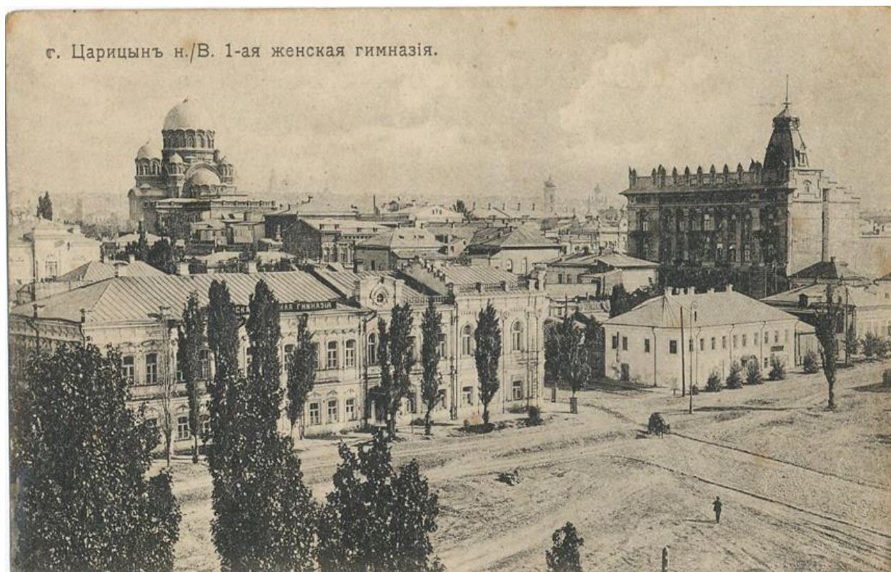
Рисунок В.3 – Здание 1-й Мариинской женской гимназией