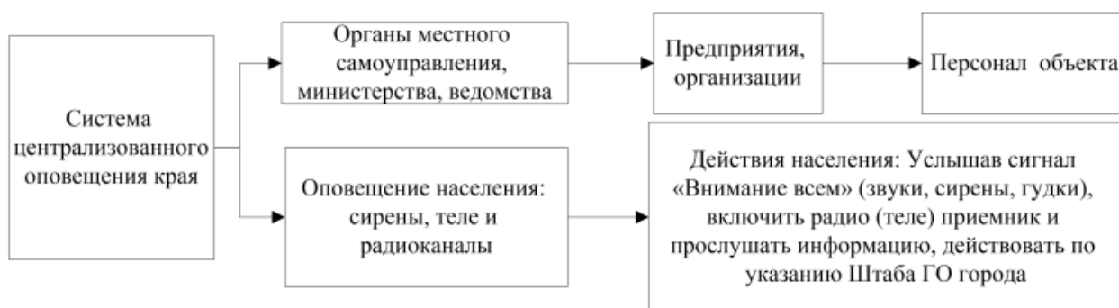
Рисунок 2 – Принципиальная схема оповещения на территории ООО «Газпром добыча Краснодар»

В режиме повседневной деятельности при проведении плановых мероприятий финансирование осуществляется на обеспечение потребностей в технике и имуществе, материальных средствах, средствах индивидуальной защиты, средствах связи, медицинских препаратов; выполнение мероприятий по подготовке руководящего состава к действиям в условиях ЧС.