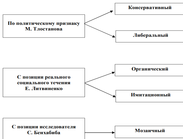
Рисунок 1 - Типы мультикультурализма [39]

Исследователь М. Тлостанова проводит анализ различных подходов к мультикультурализму, уделяя особое внимание их политическому уклону. В ходе исследования автор выявляет разновидности мультикультурализма, представленные в современной политической практике, и анализирует их влияние на формирование социокультурной среды.