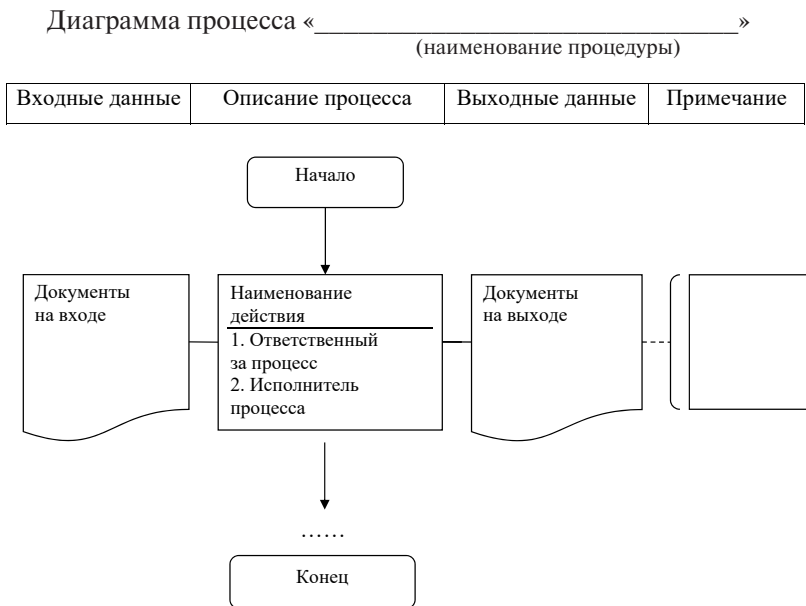
Рис. А.1. Диаграмма процесса (регламентированная процедура)

9. После полного построения диаграммы со всеми действиями процесса ставится блок «Конец» (см. рис. А.1).