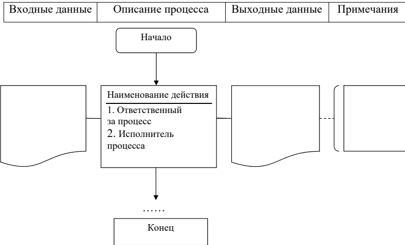
Диаграмма процесса « _____ » название процедуры