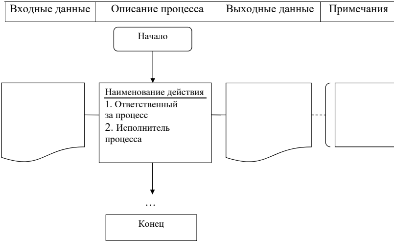
Диаграмма процесса « _____ » название процедуры