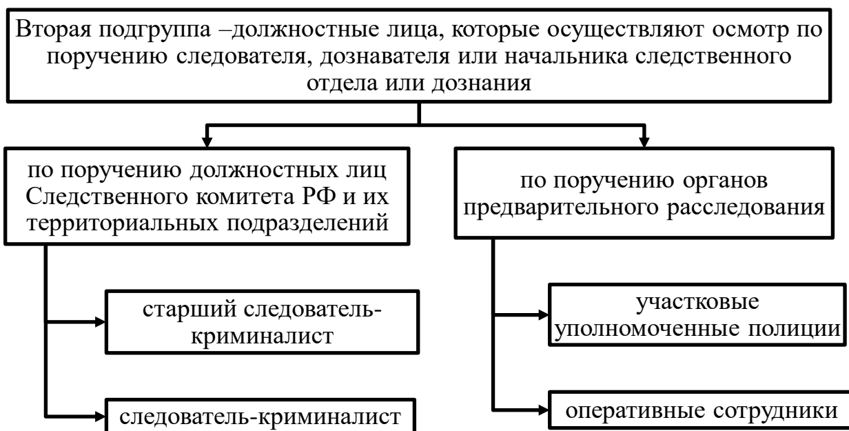
Рисунок 2 – Должностные лица, которые осуществляют осмотр по поручению следователя, дознавателя или начальника следственного отдела или дознания [43]

Представителями второй группы обозначим обязательных участников осмотра, которые в формальном понимании не являются участниками уголовного судопроизводства, однако вступают в правоотношения с органами предварительного расследования в силу их пролонгированной возможности обязательного участия в следственном действии – осмотре, в соответствии с нормами действующего УПК РФ. К ним относятся: