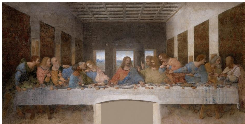
Рисунок 4 – Леонардо да Винчи «Тайная вечеря». 1495-1498 г.

6 показаны работы известных художников, демонстрирующие проблему нравственного выбора.