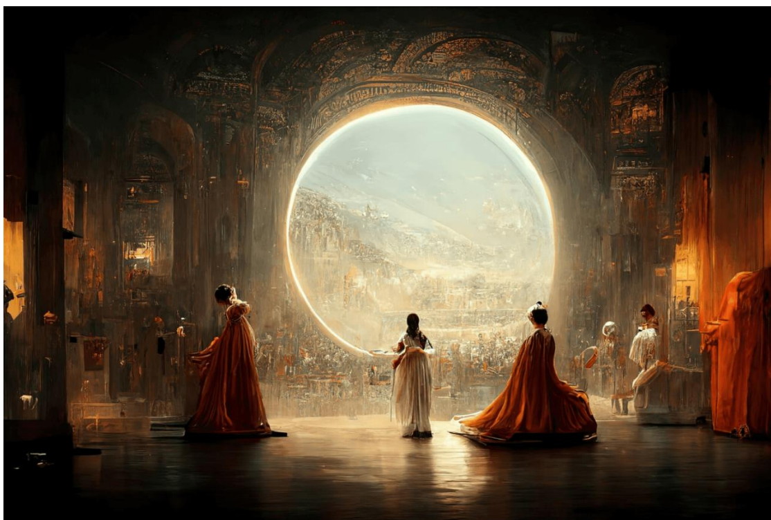
Рисунок 1 – «Театр космической оперы»

Работы, созданные искусственным интеллектом, не только нарушают авторское право, лишают начинающих художников заработка и мотивации к работе, но и обесценивают творчество и многолетний труд авторов.