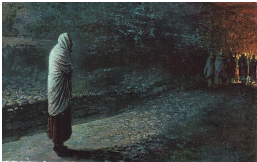
Рисунок 9 – Н. Ге «Совесть. Иуда», 1981 г.

Хороший пример такого взгляда на Иуду – картина Николая Ге «Совесть. Иуда», что представлена на рисунке 9.