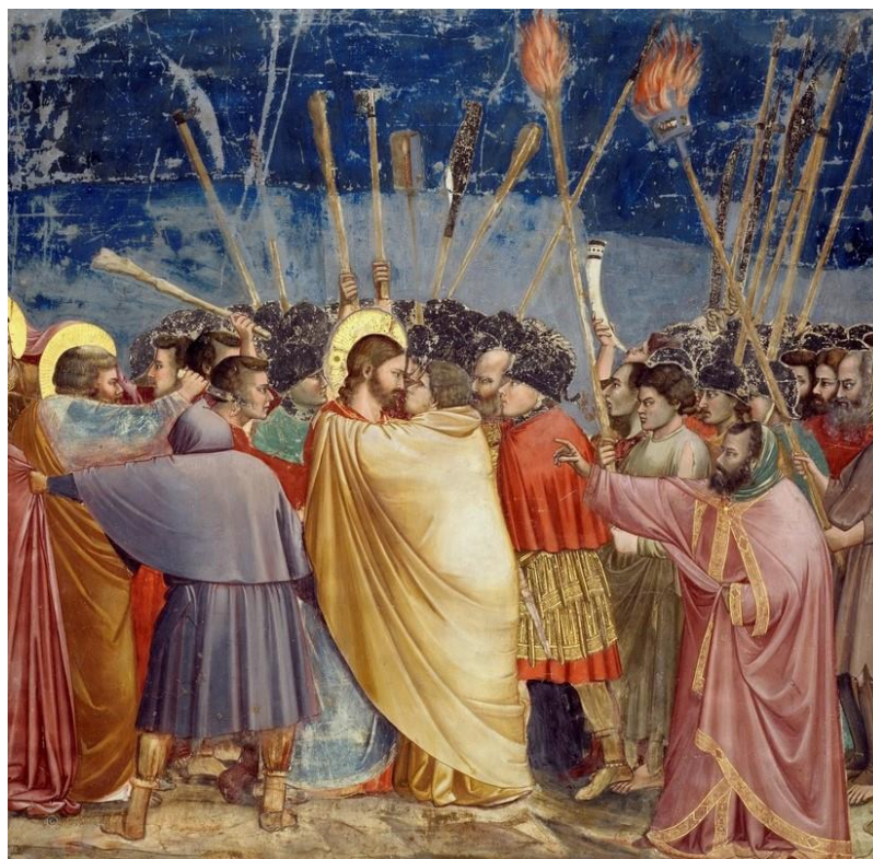
Рисунок 7 – Джотто ди Бондоне. Фреска «Поцелуй Иуды»

часто изображается сжимающим в руках денежный мешок. Опять же, это символизирует его жадность. Наконец, Иуда (и другие евреи) часто изображаются с рыжими волосами. Это символ сатанинства. Некоторые работы, которые показывают эти мотивы в изображениях предательства в саду. Рассмотрим фреску Джотто «Поцелуй Иуды» представленную на рисунке 7.