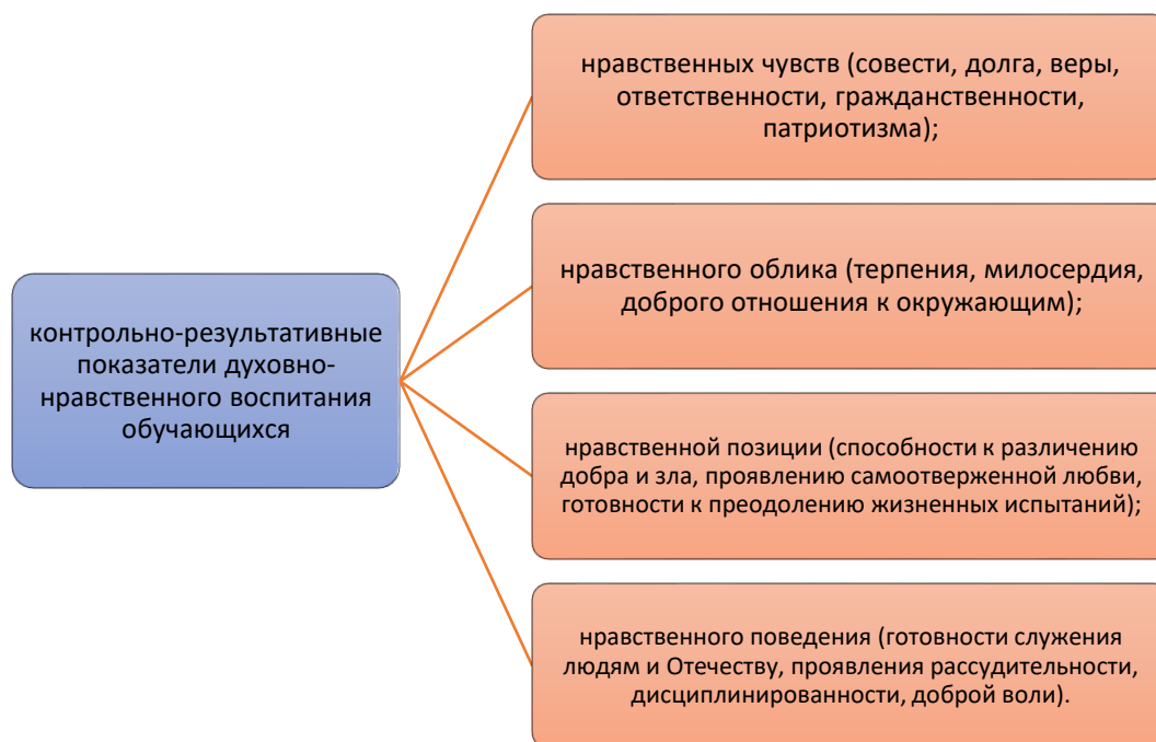
Рисунок 3 – контрольно-результативные показатели духовно-нравственного воспитания обучающихся

На рисунке 3 представлен контрольно-результативные показатели духовно-нравственного воспитания обучающихся представляющие собой процесс становления и развития личности, формирования у него лично-смысловых духовных факторов и ценностных ориентаций.