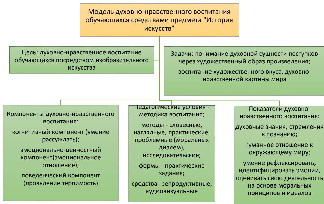
Рисунок 2 – Модель методической системы

Модель методической системы представлена на рисунке 2.