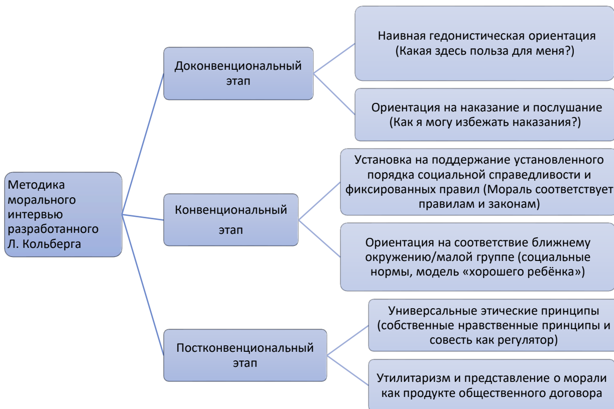
Рисунок 9 – Теория морального развития Л. Кольберга

Методика морального интервью разработанного Л. Кольберга представлена на рисунке 9.