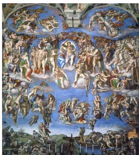
Рисунок 6 – Микеланджело «Страшный суд», 1537-1541 г.