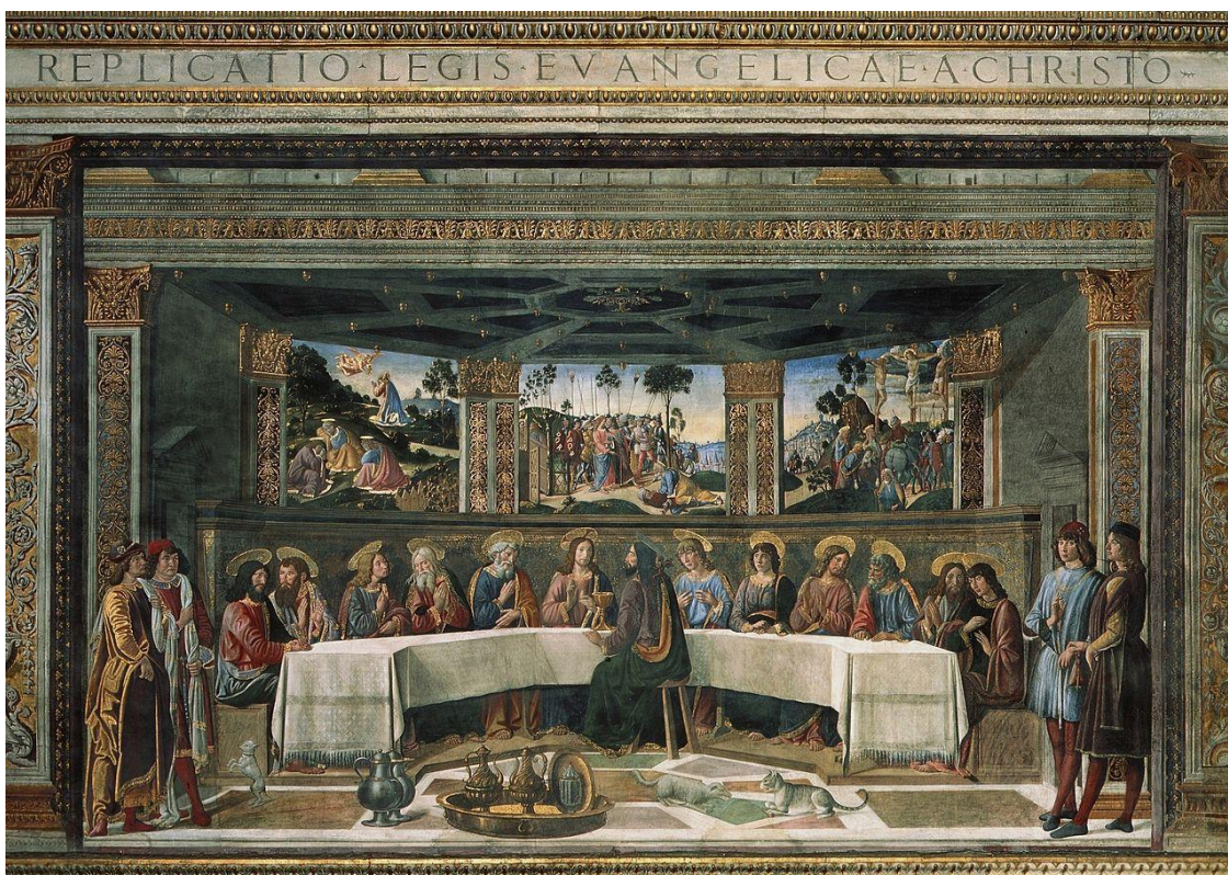
Рисунок 8 – «Тайная вечеря» Козимо Росселли, Бьяджо д'Антонио, 1482 г.

Более тонкое изображение сатанинского можно увидеть в работе Козимо Росселли «Тайная вечеря» (1481 г.), что представлено на рисунке 8.