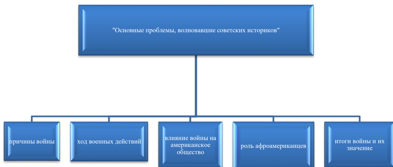
Рисунок 3-Основные проблемы, волновавшие советских историков при изучении Гражданской войны в США в период 1945–1964 гг

Приведенный рисунок 3 демонстрирует ключевые вопросы, которые вызывали озабоченность у советских ученых-историков в процессе анализа Гражданской войны в Соединенных Штатах, подчеркивая тем самым сложность и многогранность данной исторической эпохи.