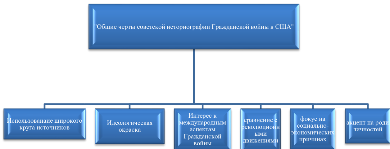
Рисунок 2-Общие черты советской историографии Гражданской войны в США в период 1945–1964 гг

Выше представлен рисунок 2, отражающий общие черты советской историографии Гражданской войны в США, на этот раз с описаниями на русском языке. Каждый элемент схемы подробно описывает ключевые аспекты исследования, такие как идеологическая окраска, фокус на социально-экономических причинах, акцент на роли личностей, сравнение с революционными движениями, интерес к международным аспектам, и использование широкого круга источников.