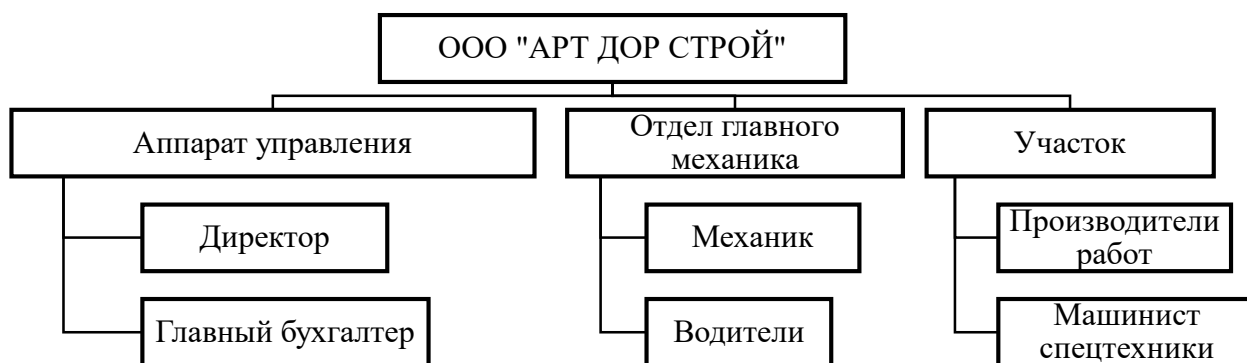
Рисунок 1 – Организационная структура управления ООО «АРТ ДОР СТРОЙ»

Директор осуществляет руководство компании, а именно решает вопросы, которые связаны с работой предприятия. В функции главного бухгалтера и бухгалтера входит контроль за составлением бухгалтерской отчетности, взаимодействие с налоговой, обработка первичной документации, а также расчет и выплата заработной платы. Юрист компании занимается составлением договоров и сопровождением сделок, а также работает с внутренним документооборотом компании. В обязанности инженера ПТО входит контроль качества, объемов и сроков выполнения ремонтно-строительных, монтажных и пусконаладочных работ, а также оформление исполнительной документации и сдача объектов в эксплуатацию. HR менеджер компании занимается подбором персонала.