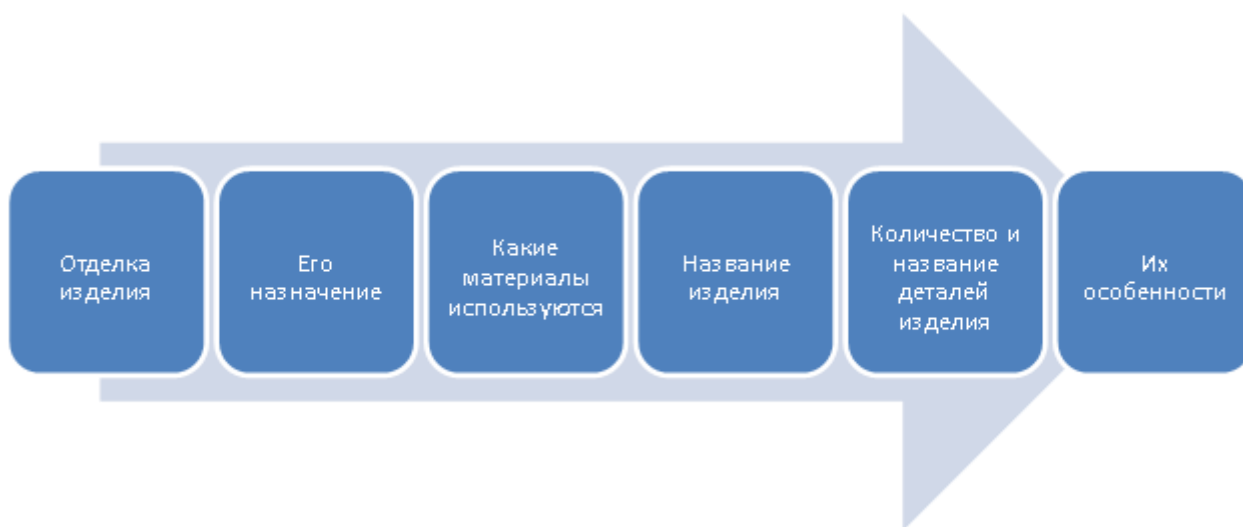
Рисунок А.1 – Стимульный материал к заданию 2

«Практическое задание – посмотри верный ли алгоритм представлен здесь, что нужно исправить и дополнить?» [12] (рисунок А.1)