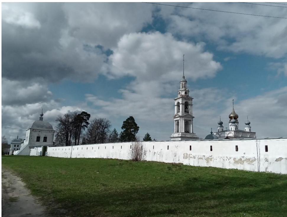
Рисунок А.4 – Свято-Николо-Тихонов монастырь (2022 г.)