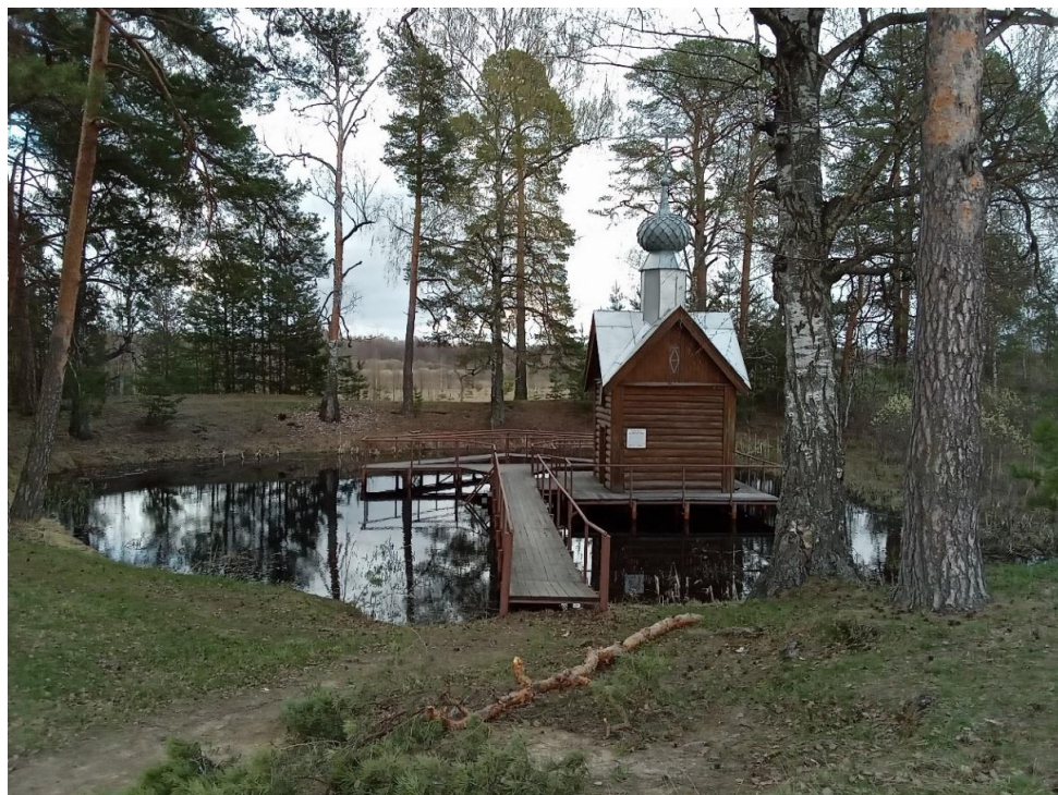
Рисунок А.5 – Прудик святого Тихона в окрестностях Свято-Николо-Тихонова монастыря, выкопанный, согласно житию данного святого, им самолично и почитаемый ныне местными жителями в этом же статусе