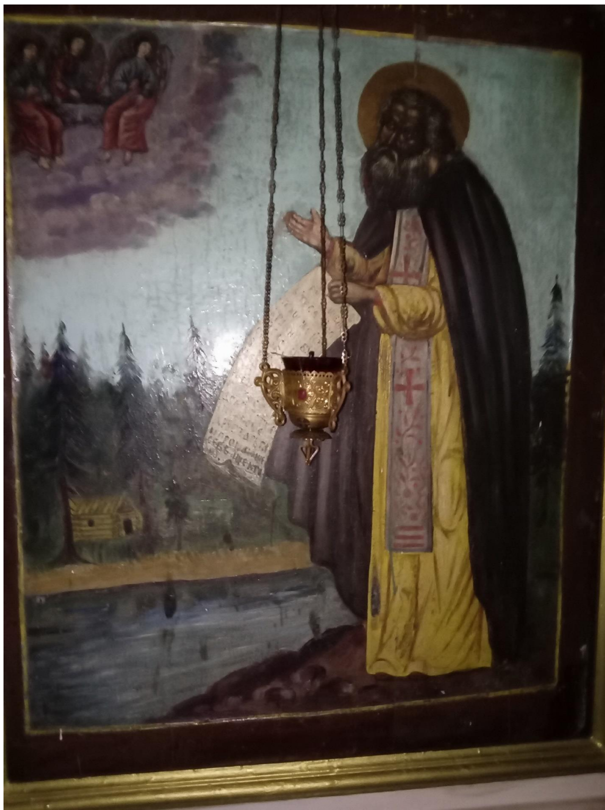
Рисунок А.3 – Храмовая иконка Богоявленской церкви в с. Худынское (иконописный сюжет – преп. Макарий в молении Святой Троице на фоне житийной келии на р. Лух)