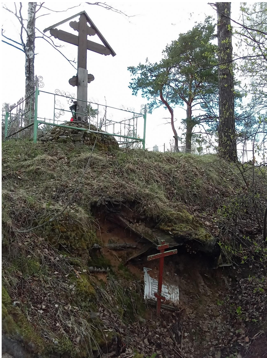
Рисунок А.1 – Местечко «Пещерка» возле Богоявленской церкви в с. Худыньское