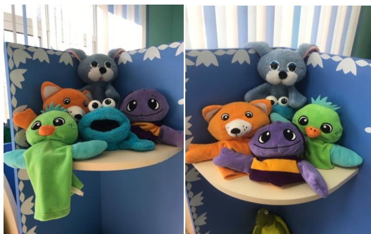
Рисунок 2 – Куклы Би-ба-бо

В соответствии с первым пунктом формирующей работы – обогащение развивающей предметно-пространственной среды атрибутами и материалами для кукольного театра (куклами «Би-ба-бо», куклами на гапите, фигурками для теневого театра) в соответствии с возрастными особенностями детей. Мы провели анализ предметно-пространственной среды и сделали вывод о том, что нужно сформировать в группе уютный микроклимат, который будет помогать ребенку лучше воспринимать информацию. Так как в группе уже есть уголок «Театральной деятельности», то можно расширить его содержание, добавив разными фигурками для теневого театра, куклы, куклы-перчатки. Мы разнообразили наличие кукол Би-ба-бо и добавили новые персонажи, такие как: «пчелка», «птичка», «лягушонок» (рисунок 2).