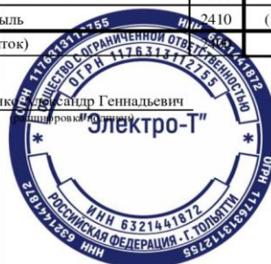
Рисунок А.1 - Отчет о финансовых результатах ООО «Электро-Т» на 31 декабря 2022 г.