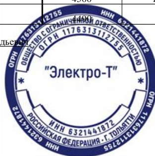
Рисунок В.1 - Отчет о движении денежных средств ООО «Электро-Т» на 31 декабря 2022 г.