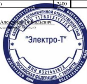
Рисунок Б.2 - Отчет о финансовых результатах ООО «Электро-Т» на 31 декабря 2021 г.