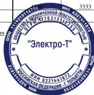
Рисунок Г.1 - Отчет о движении денежных средств ООО «Электро-Т» на 31 декабря 2021 г.