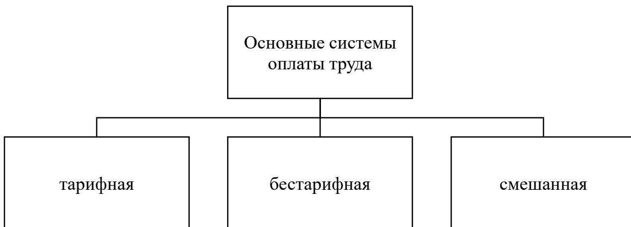
Рисунок А.1 - Основные системы оплаты труда