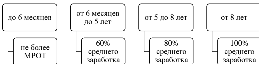
Рисунок М.1 – Коэффициенты трудового стажа