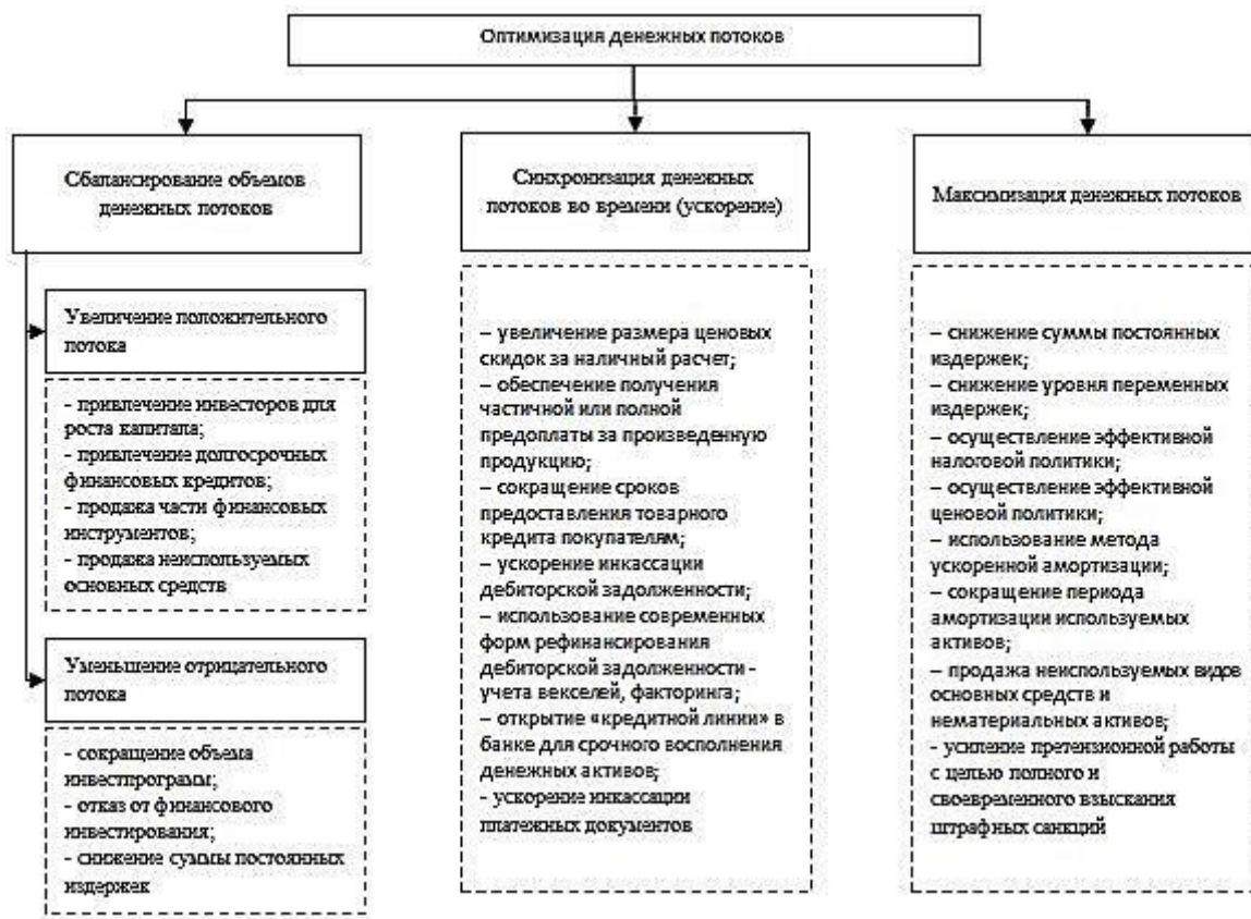
Рисунок Д.1 – Методы оптимизации денежных потоков