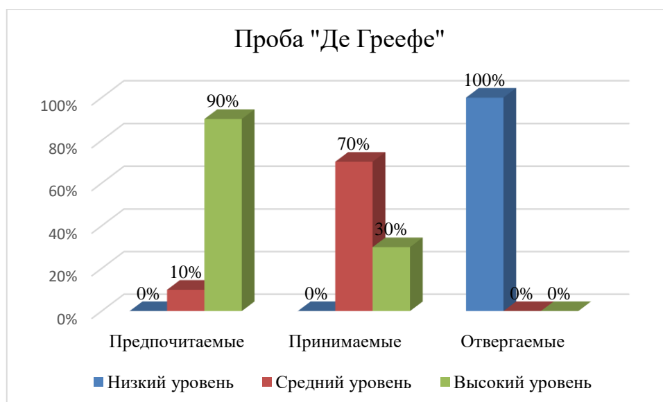
Рисунок 4 – Уровень развития самооценки у младших школьников по результатам проведения пробы «Де Греефе»

Как видно из рисунка 4, у большинства младших школьников, имеющих социальный статус «Предпочитаемые», уровень развития самооценки – высокий. Таких учеников 22, что составляет 90% от общего числа испытуемых данной группы. Данные школьники в себе уверены, умеют оценивать себя и свои действия, сверстники с ними общаются с желанием. Средний уровень развития самооценки был выявлен у 3 (10%) младших школьников данной группы. Данные школьники адекватно оценивают свою позицию в классе. Низкий уровень развития самооценки у младших школьников, имеющих социальный статус «Предпочитаемые» по результатам проведения пробы «Де Греефе» выявлен не был ни у одного испытуемого данной группы.