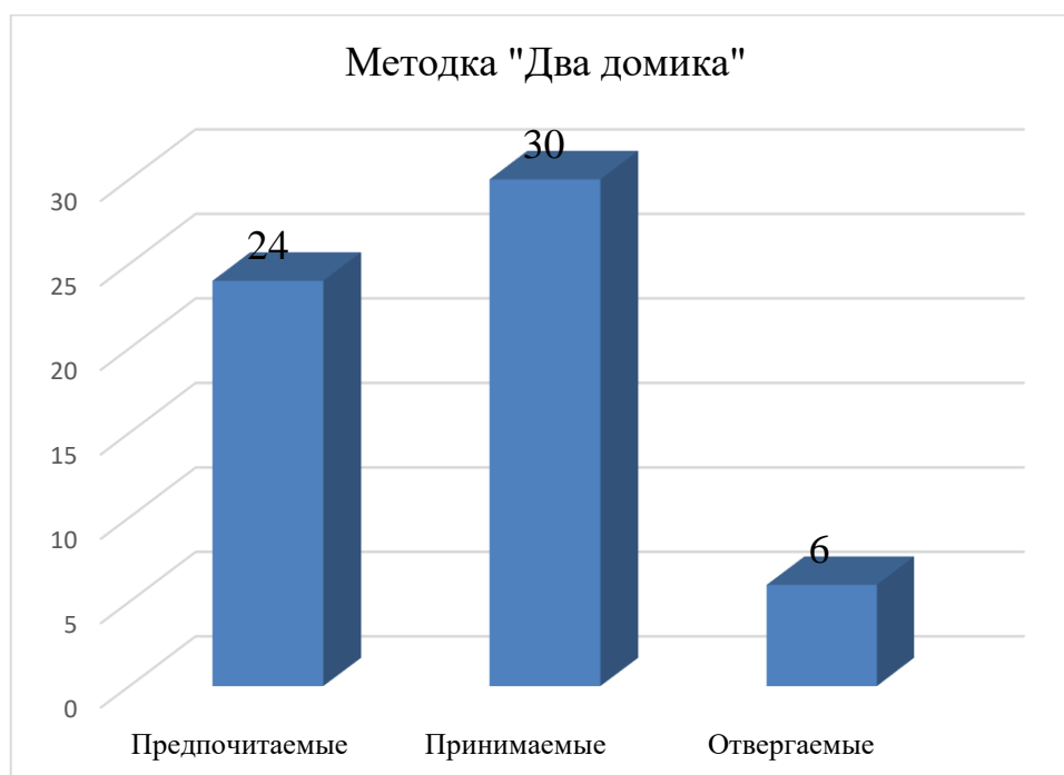
Рисунок 1 – Социальный статус младших школьников

Результаты, полученные в ходе проведения данной методики представлены на рисунке ниже (рисунок 1).