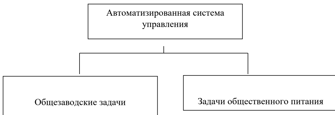
Рисунок 2- Схема автоматизированной системы управления ЗАО КШП «ДРУЖБА».

Во всех подразделениях комбината питания действует автоматизированная система управления, включающая следующие подсистемы (рисунок 2).