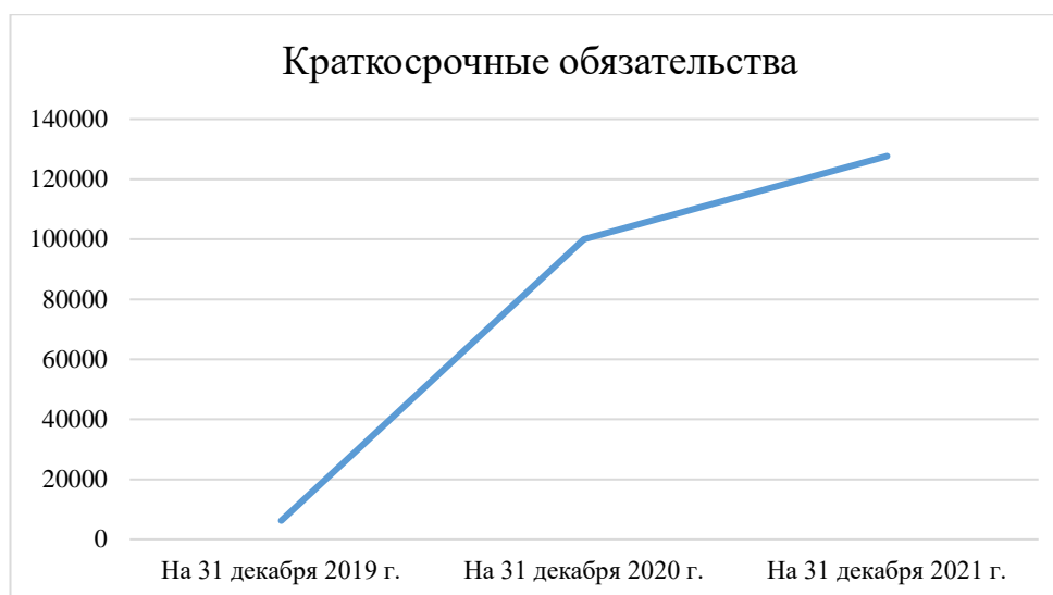
Рисунок 4 – Краткосрочные обязательства ООО «ББС Штамп»

Завершив анализ бухгалтерского баланса исследуемого предприятия, перейдём к изучению отчёта о финансовых результатах общества с ограниченной ответственностью «ББС Штамп». Анализ отчёта о финансовых результатах компании будет представлен в таблице 7.