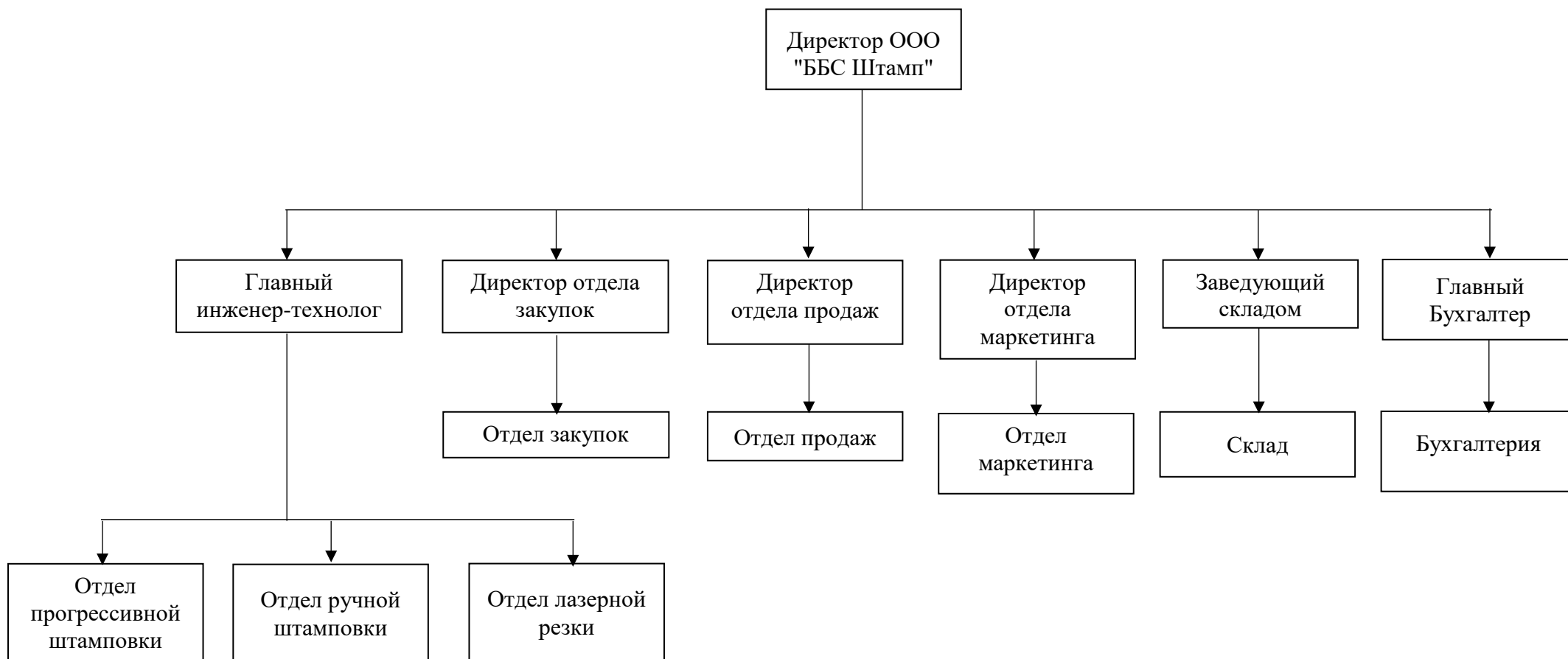
Рисунок А.1 – Организационная структура ООО «ББС Штамп»