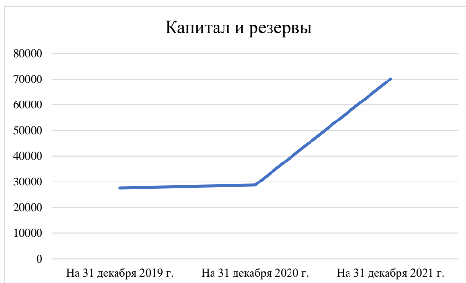
Рисунок 3 – Капитал и резервы ООО «ББС Штамп»

Продолжим анализ финансового состояния предприятия и перейдем к рассмотрению долгосрочных обязательств общества с ограниченной ответственностью «ББС Штамп» (таблица 5).