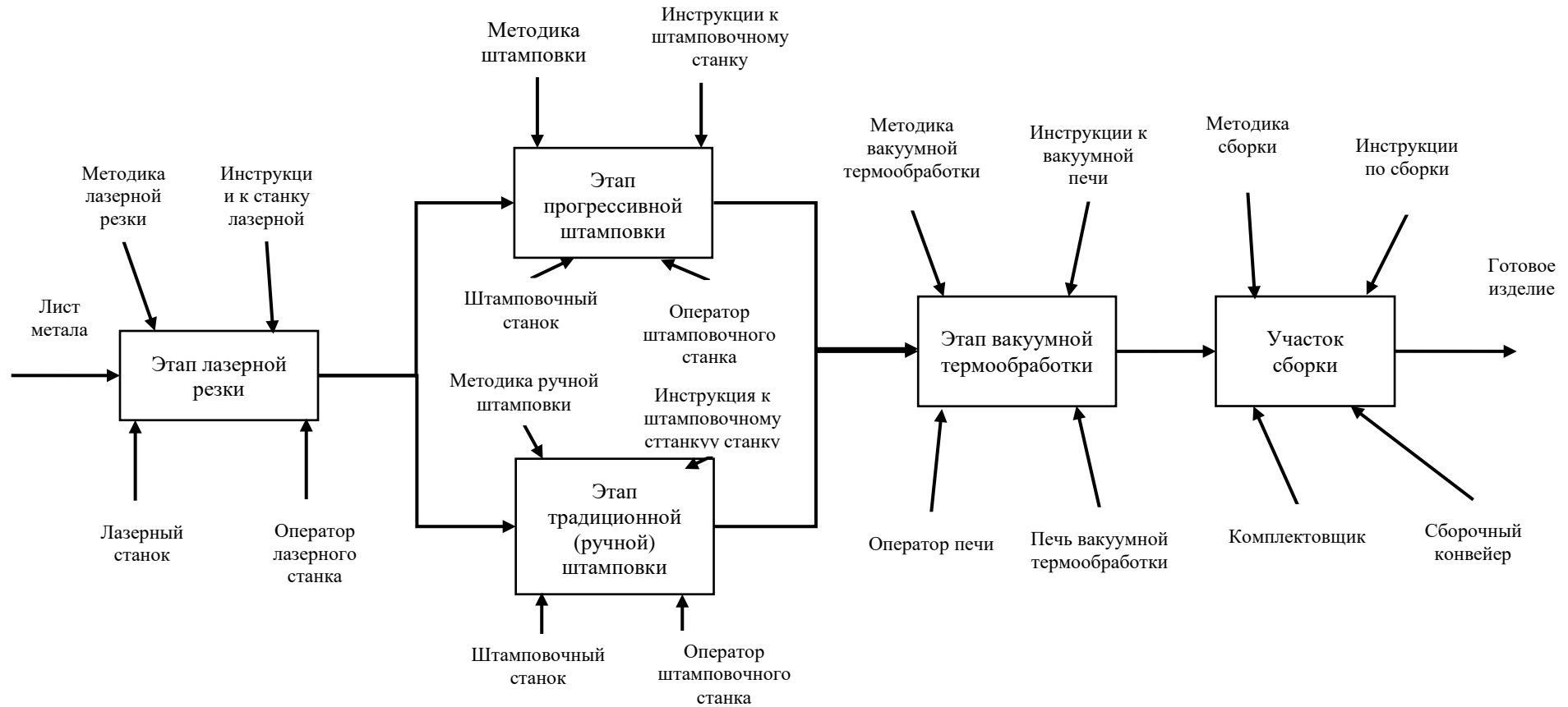
Рисунок В.1 – Схема производственного процесса в ООО «ББС Штамп»