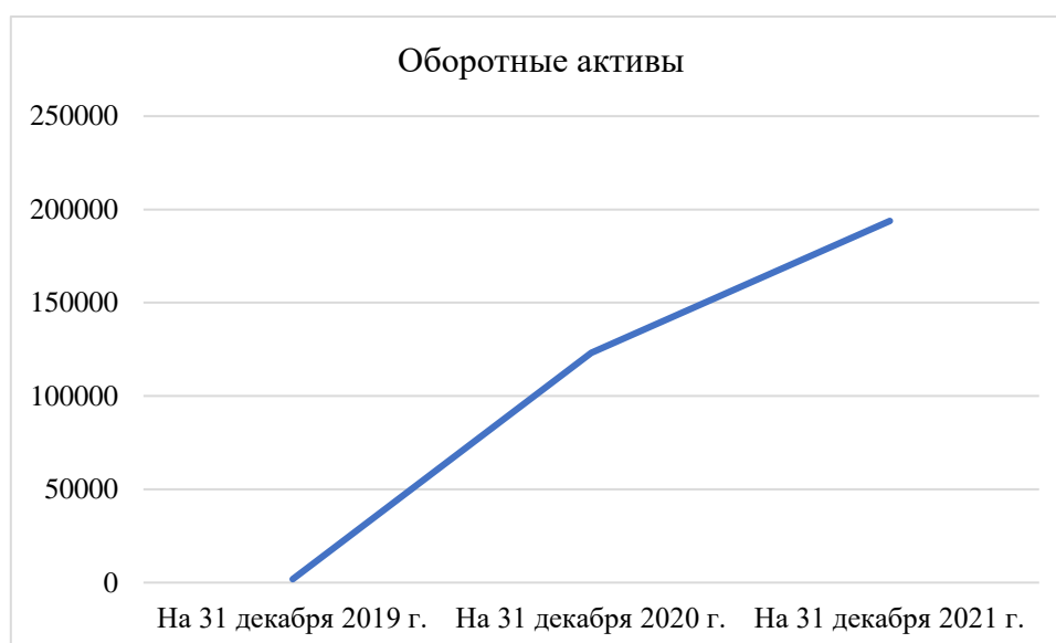
Рисунок 2 – Оборотные активы ООО «ББС Штамп»

В 2020 году появляются прочие оборотные активы предприятия на сумму 12 тысяч рублей, а в 2021 году происходит их увеличение на 5 тысяч рублей. На основе данных, представленных в таблице 3, построим график, который отразит динамику движения оборотных активов исследуемого предприятия (рисунок 2).