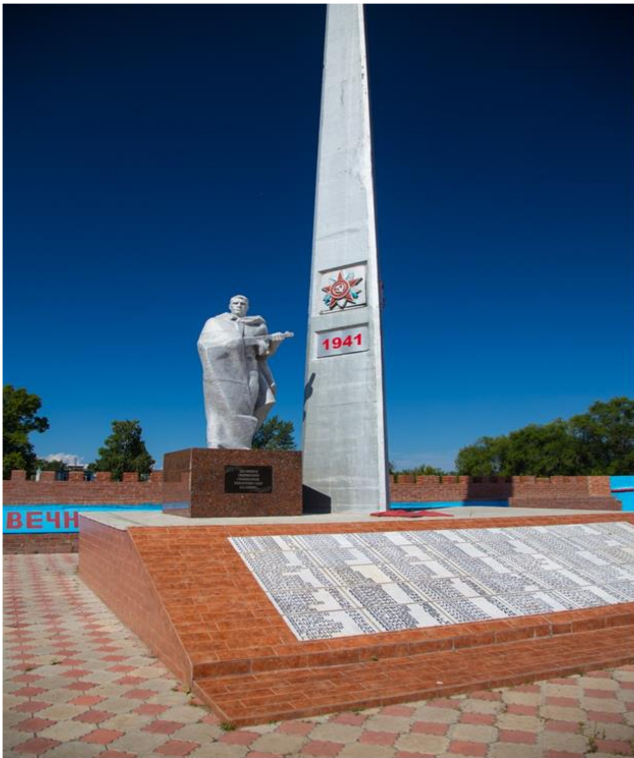
Рисунок А.6 – Фотография. Памятник близ ДК «Современник» памяти погибшим в ВОВ