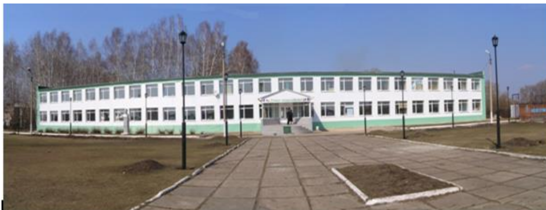
Рисунок А.5 – Фотография. Снимок ГБОУ лицея с. Хрящевка. 2011 год