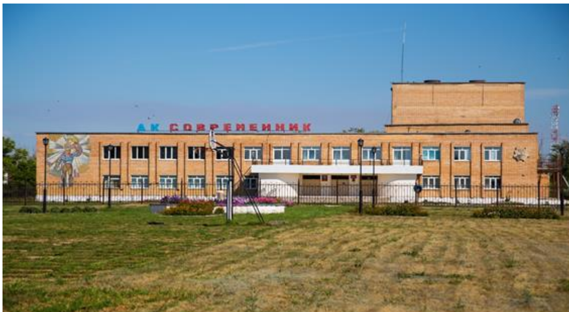
Рисунок А.4 – Фотография. Снимок ДК Современник, взятый из архива модельной библиотеки-филиала РМУК. 2011 год