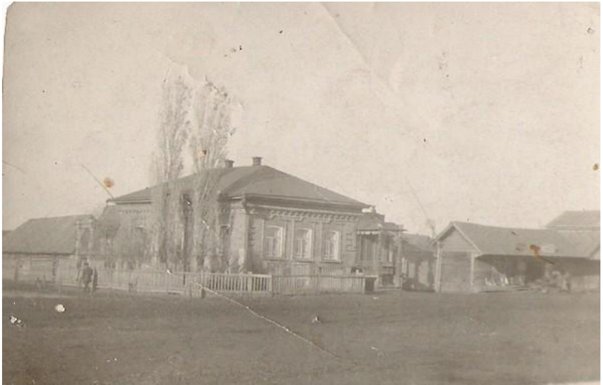
Рисунок А.2 – Фотография. Вид на один из домов села Хрящевка. 1929 год