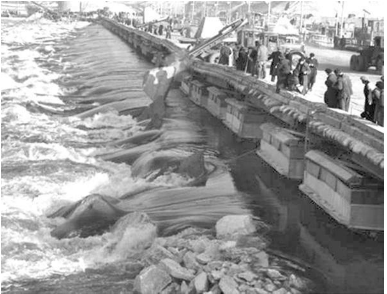
Рисунок А.3 – Фотография. Введение в эксплуатацию Куйбышевской ГЭС. 1957 год