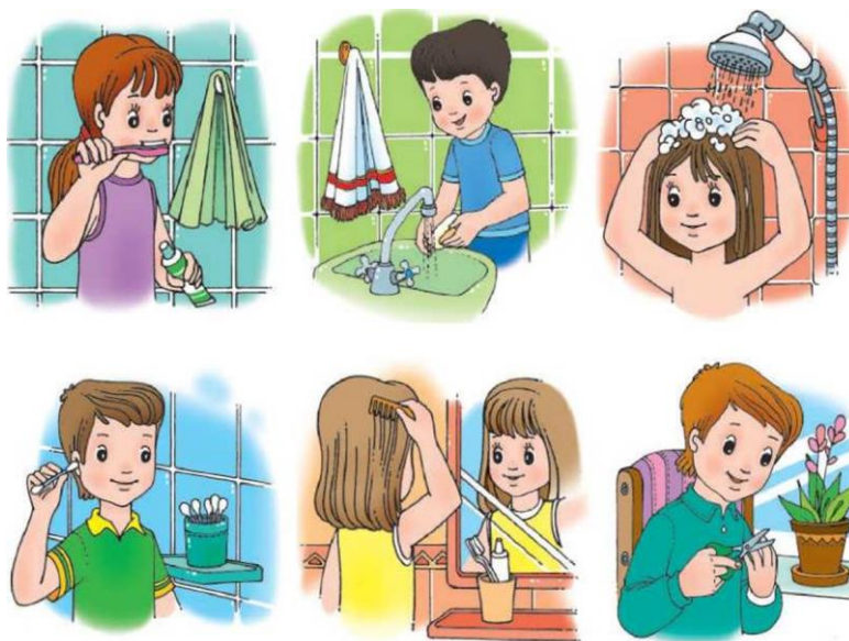
Рисунок Е.5 – Иллюстрация навыков гигиены