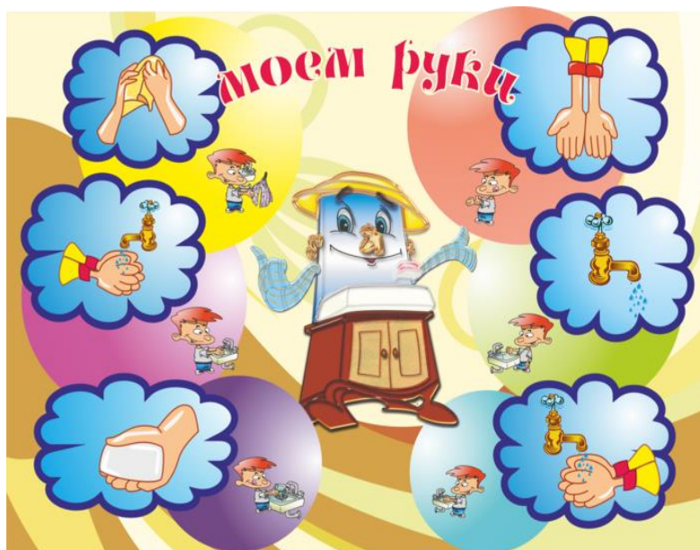
Рисунок Е.1 – Иллюстрация к навыку мытья рук