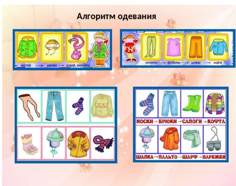
Рисунок Е.4 – Иллюстрация к навыку надевания и раздевания