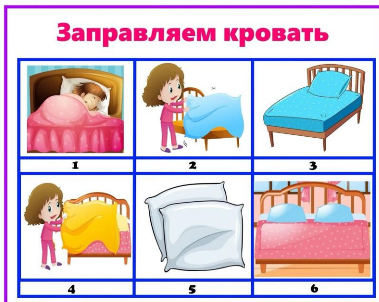
Рисунок Е.3 – Иллюстрация к навыку уборки спального места