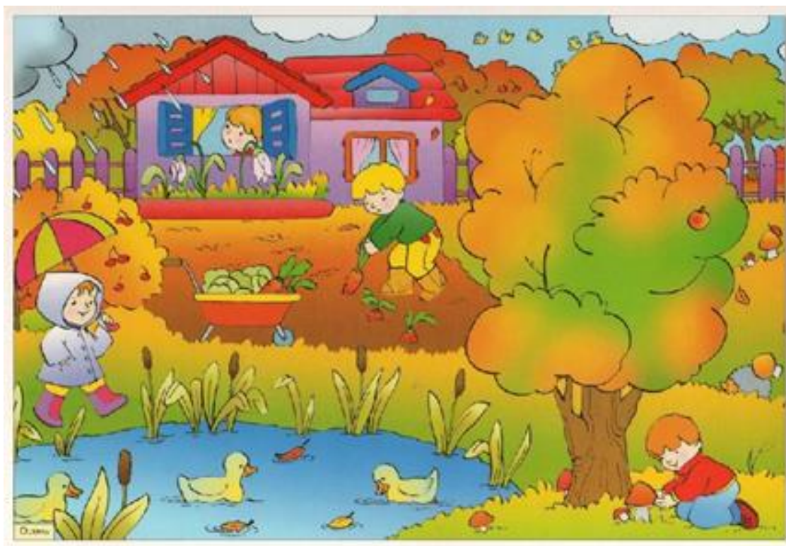
Рисунок Б.2– Изображение, используемое в задании 3