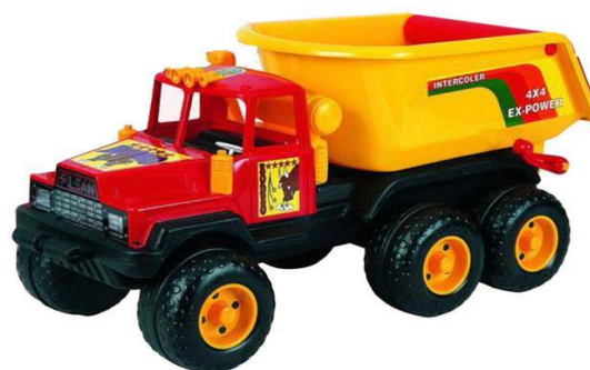
Рисунок Б.3– Изображения, используемые в задании 4