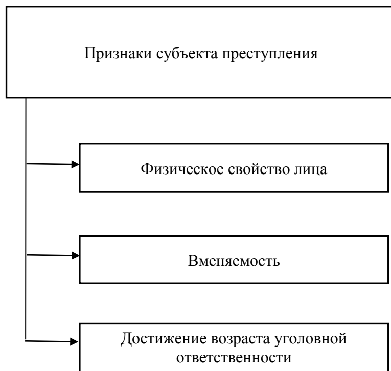
Рисунок 1 – Признаки субъекта преступления