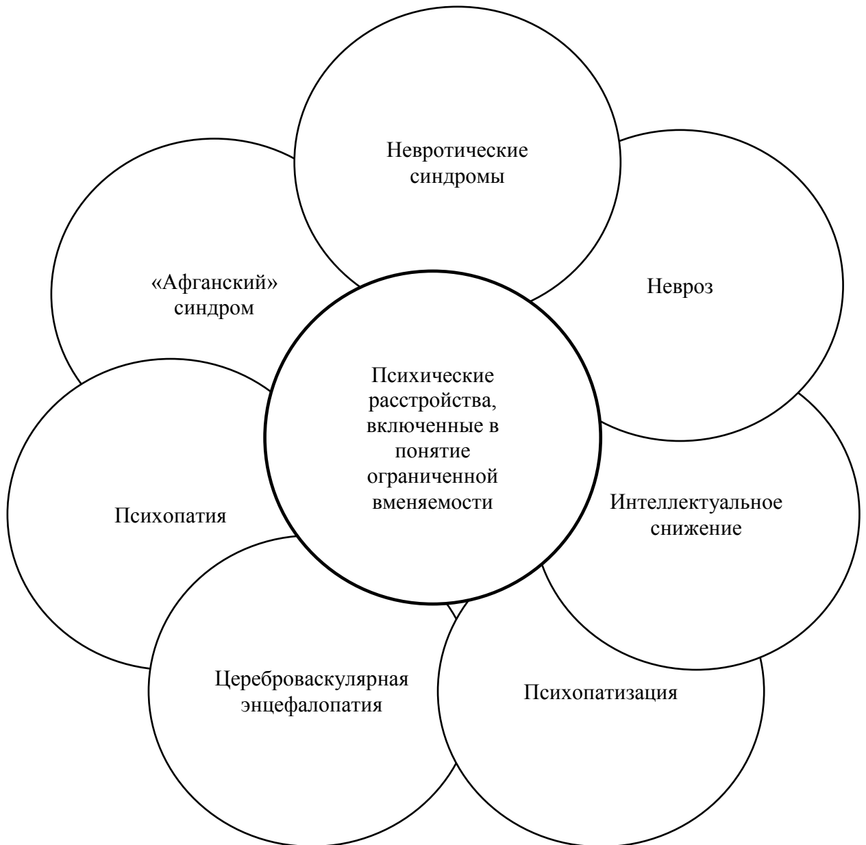
Рисунок 3 – Психические расстройства, включенные в понятие ограниченной вменяемости