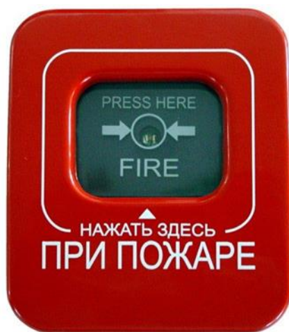
Рисунок 2 - Тревожная кнопка при пожаре.

В коридоре, рядом с постом охраны, расположена тревожная кнопка. Примерное изображение показано на рисунке 2.