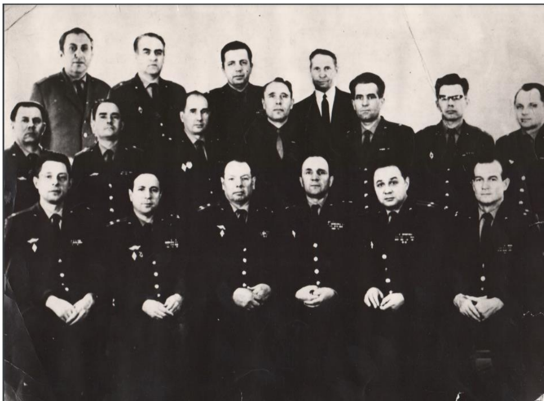
Рисунок Б.1 – Коллектив военной кафедры ТПИ (ныне ТГУ) 1970 год