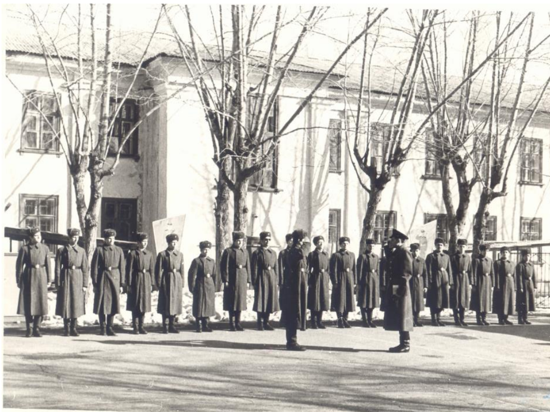
Рисунок Б.2 – Построение у здания военной кафедры ТПИ в 1970 г.