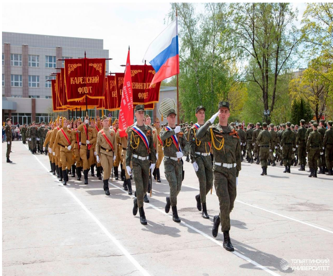
Рисунок В.5 – Парад 7 мая 2021 года, перед главным корпусом ТГУ