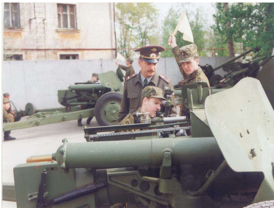
Рисунок В.3 – Практические занятия 2002 год