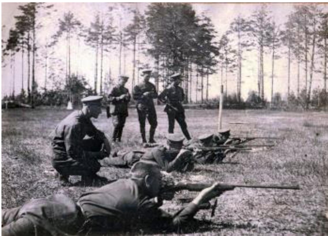
Рисунок А.1 – Студенты Ивановского химико-технологического института на военных сборах. 1934 год