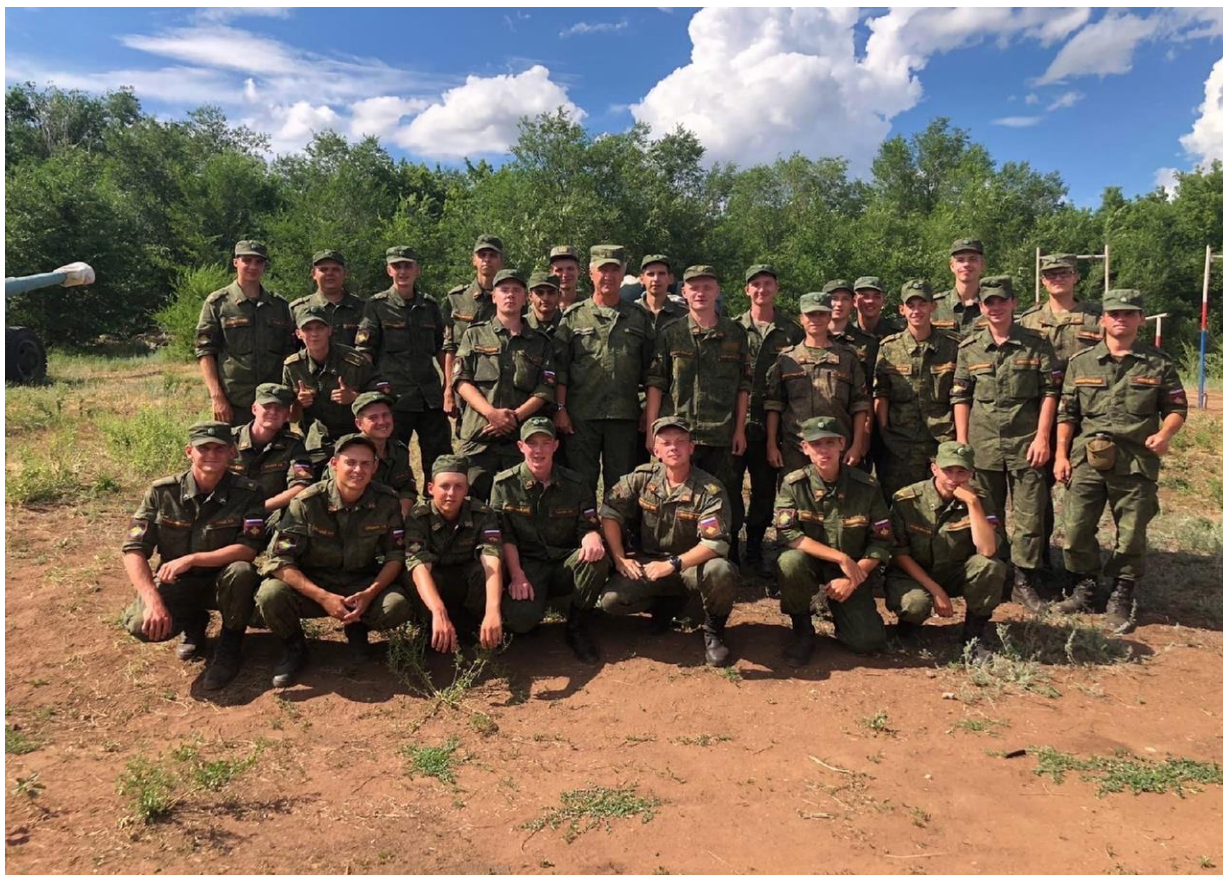
Рисунок В.7 – Учебный взвод курсантов Тольяттинского государственного университета после сдачи итоговых квалификационных экзаменов. 3 июля 2021 год