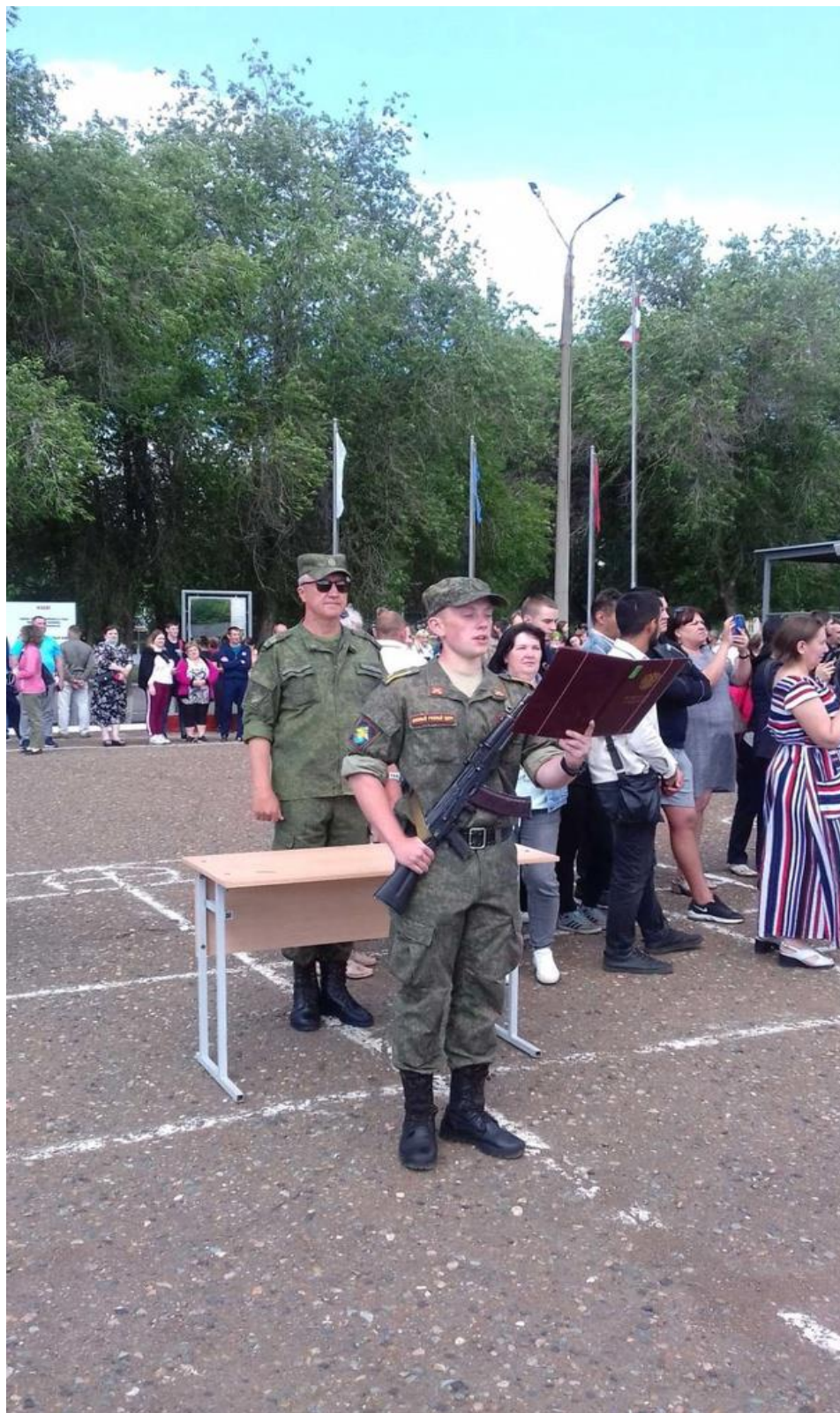
Рисунок В.6 – Принятие военной присяги курсантом военной кафедры ТГУ 12 июня 2021 год