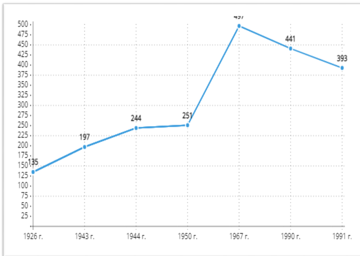
Рисунок Б.3 – Количество военных кабинетов и кафедр при высших и средних учебных заведениях СССР с 1926 по 1991 годы