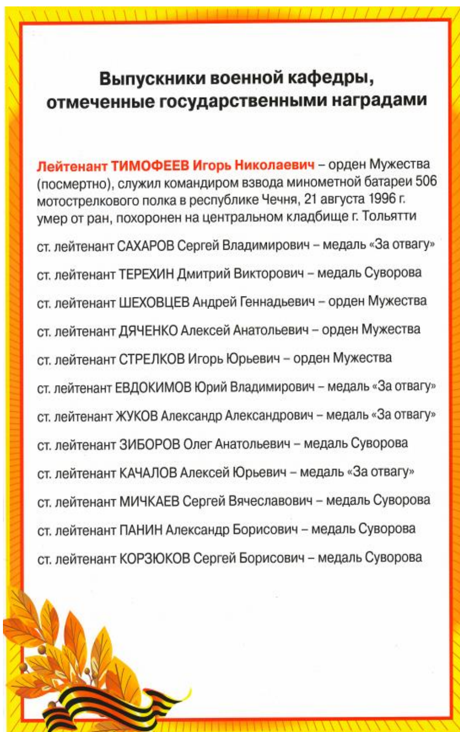
Рисунок В.1 – Выпускники военной кафедры, отмеченные государственными наградами