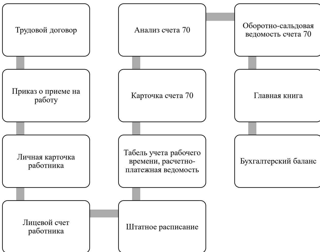
Рисунок 2 – Документальное оформление расчетов по оплате труда

Чтобы в ООО «ГК «Авто-69» вести учет рабочего времени применяется созданный Табель учета рабочего времени по форме №Т-13. Данный документ формируется в программе 1С: бухгалтерия 8.3. В данном документе по тарифным ставкам ведется расчет зарплаты (с учетом возможного премирования сотрудника).