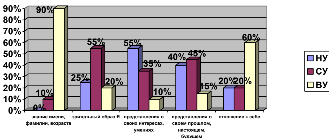
Рисунок 1 – Уровни сформированности показателей в структуре представлений ребенка 3-4 лет о себе и своих умениях

По результатам проведения всех диагностических заданий мы составили диаграмму, в которой отражены уровни сформированности каждого показателя в структуре представлений ребенка 3-4 лет о себе и своих умениях (рисунок 1).