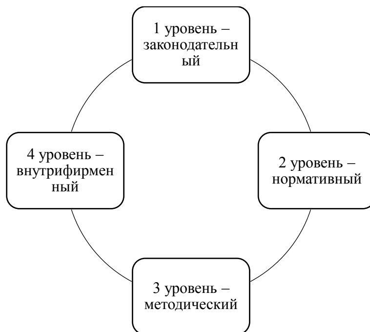
Рисунок 2 – Уровни нормативно-правового регулирования годовой бухгалтерской отчетности организации

1) 1 уровень – законодательный. «В его состав входят законы Российской Федерации, постановления Правительства РФ, указы Президента РФ, которые прямо или косвенно регулируют постановку бухгалтерского учета в организациях. Основным документом этого уровня, в частности, является ФЗ №402 «О бухгалтерском учете». Цель этого закона – установление единых требований к бухгалтерскому учету и бухгалтерской(финансовой) отчетности» [20, с. 165].