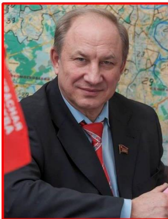
Рашкин Валерий Федорович Первый секретарь МГК КПРФ с 2010 года по н.в.