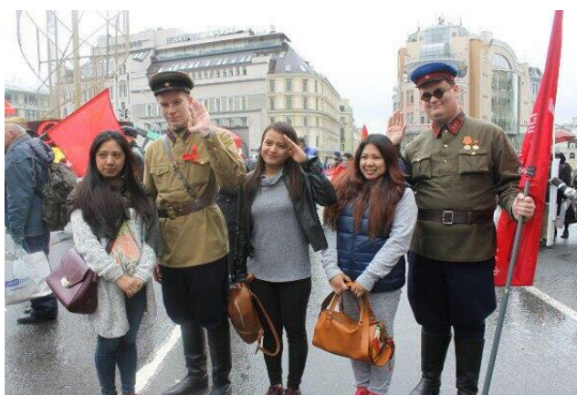
Рисунок 2 – Коммунисты Москвы в форме времен Войны фотографируются с иностранцами, 2018 год

Советского народа над нацистской Германией в Великой Отечественной войне. МГК КПРФ проводит ежегодные шествия, демонстрации и митинги, посвященные празднику. На мероприятия приглашаются все граждане, вне зависимости от их политической принадлежности. В рамках демонстрации исполняются народные песни, звучит оркестр, после прохождения колонн начинается праздничный митинг. Практически каждый год в колонне празднующих присутствуют комсомольцы и коммунисты, одетые в форму Великой Отечественной войны, что можно увидеть на рисунке 2.