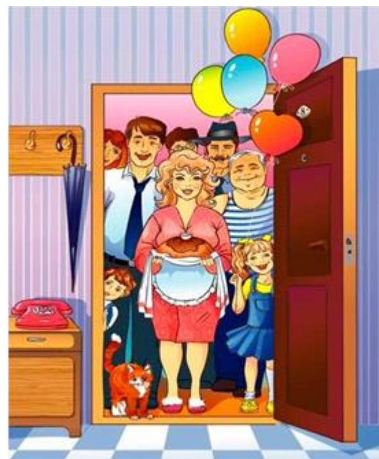
Рисунок А.2 – Иллюстрации к диагностическому заданию «Как поступить?»