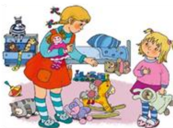
Рисунок А.1 – Иллюстрации к диагностическому заданию «Что выбрать?»