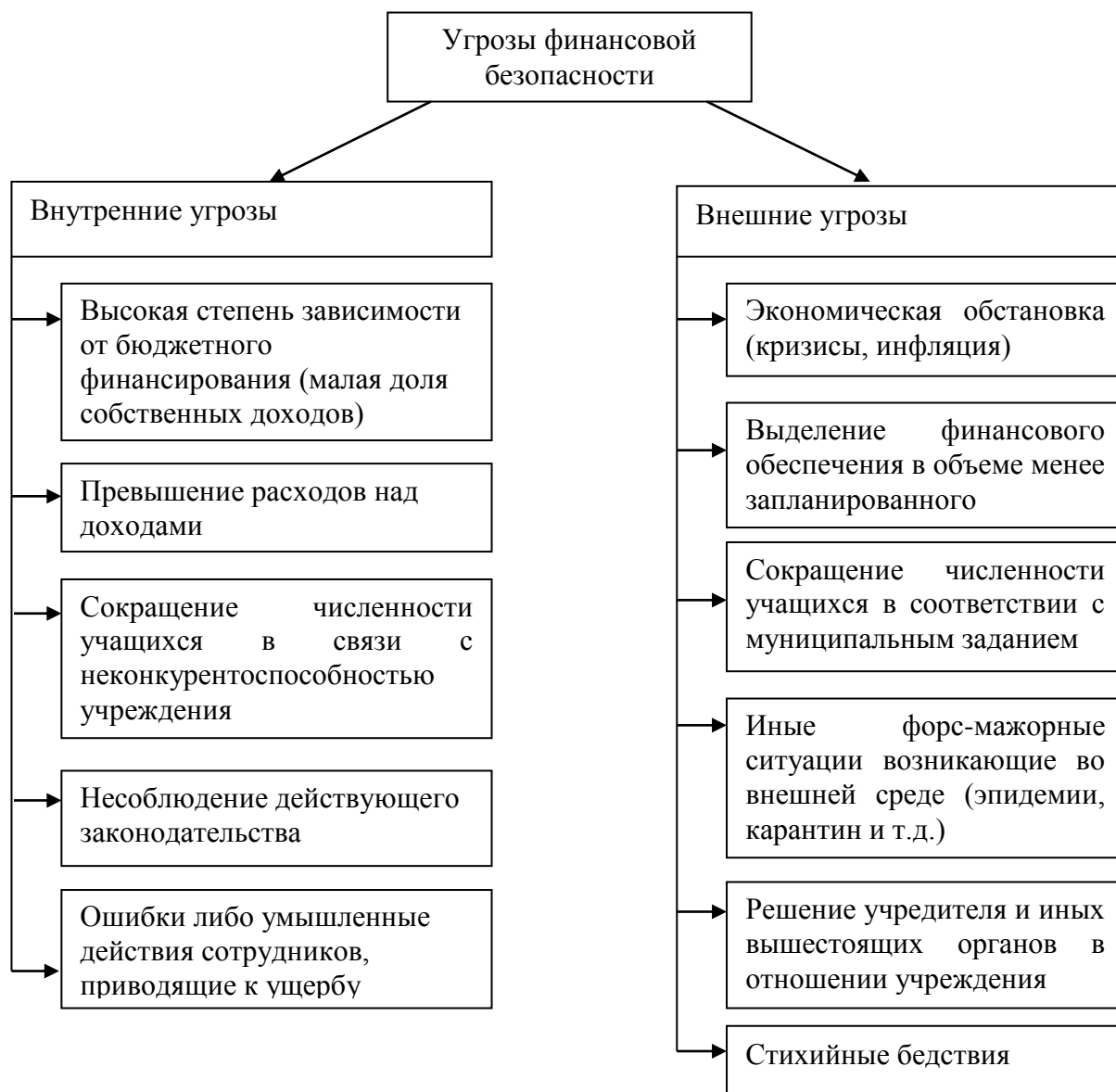
Рисунок 5 – Внутренние и внешние факторы, несущие угрозу финансовой безопасности образовательного учреждений

внутренне среде учреждения. Группировка факторов представлена на рисунке 5.