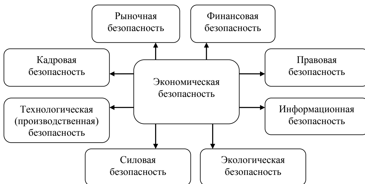
Рисунок 1 – Составляющие экономической безопасности

Например, составляющими экономической безопасности являются правовая безопасность (юридическая защищенность), кадровая безопасность (защищенность от действий персонала), информационная безопасность, финансовая безопасность и др. (рисунок 1).