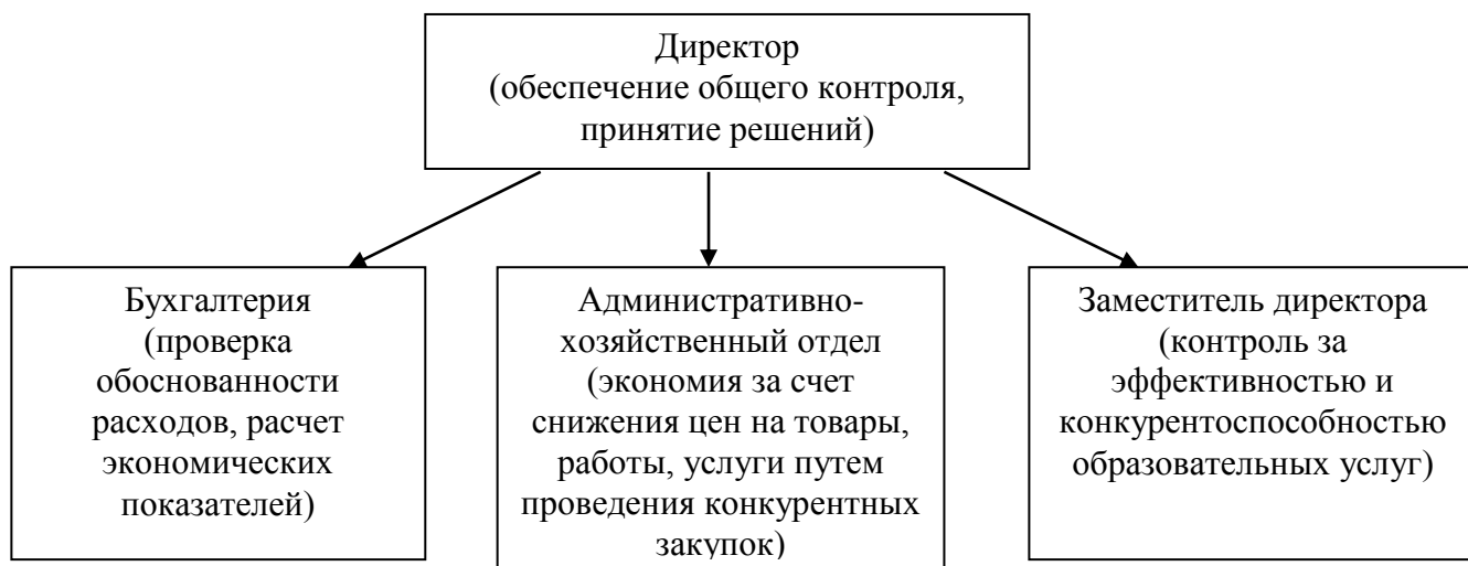
Рисунок 6 – Структурные подразделения, ответственные за обеспечение финансовой безопасности.

Конкурентоспособность образовательных услуг относится к компетенции заместителя директора. Контроль за деятельностью всех подразделений находится в ведении директора. Перечень ответственных за финансовую безопасность подразделений и сотрудников представлен на рисунке 6.