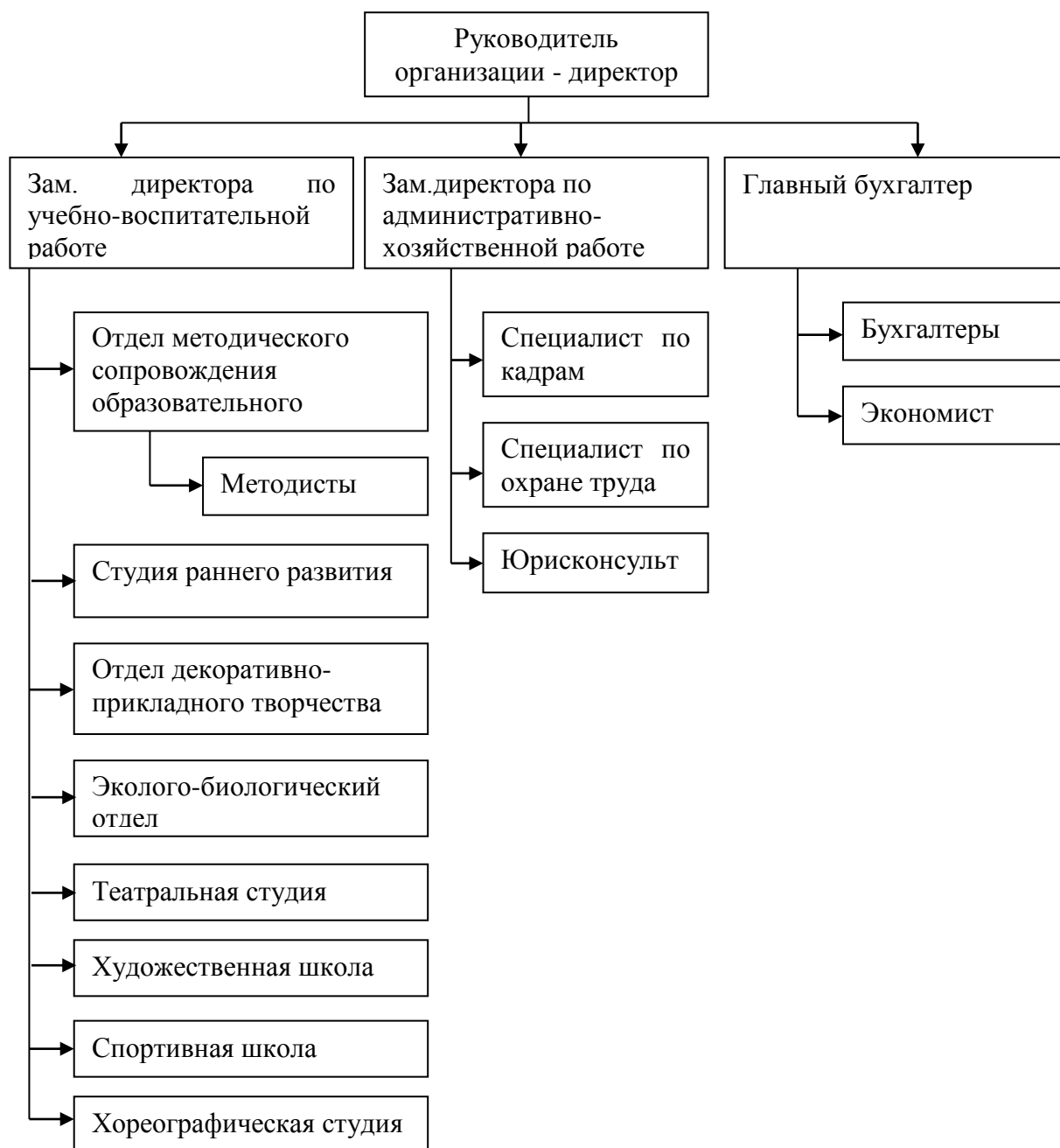
Рисунок 2 – Организационная структура МАУДО «ЦВР «Подросток»

Руководство учреждением осуществляется директором (назначается учредителем на основании трудового договора). Общая численность сотрудников составляет 340 человек. Организационная структура представлена на рисунке 2.