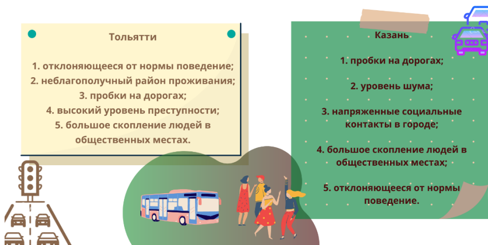
Рисунок Г.2 – Вторая часть материалов инфографики