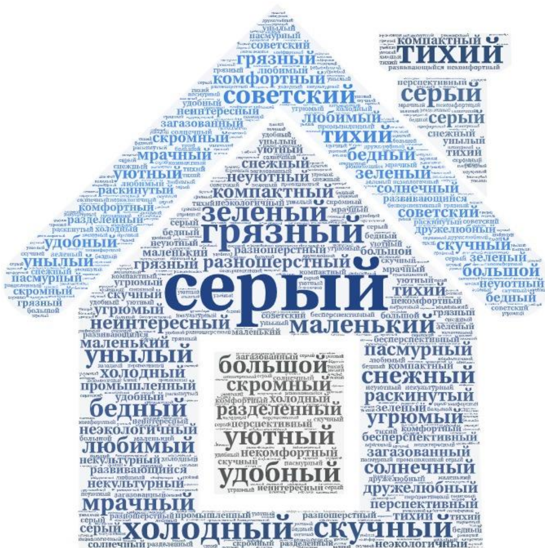
Рисунок 3 – Облако тегов «Какими прилагательными Вы бы охарактеризовали Тольятти?»

Результаты также представлены в виде смыслового облака: