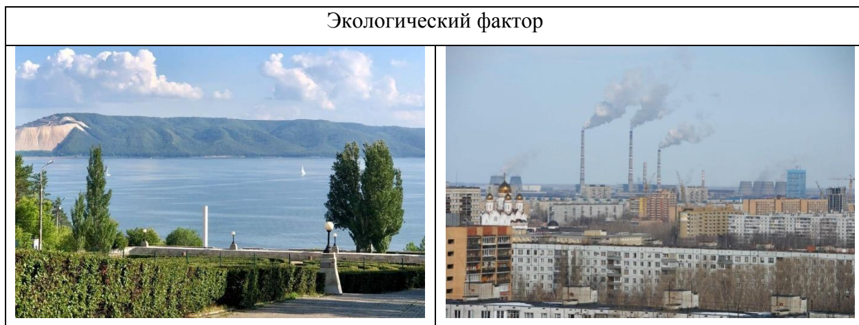
Таблица 1 – «Какая из двух картинок, на Ваш взгляд, в большей степени отображает Тольятти»

Далее информантам были предложены фотографии, на которых были изображены разные аспекты города в позитивном и в негативном восприятии. Задачей для респондентов было выбрать, какая из двух в большей степени отображает Тольятти. Картинки были разделены на 4 фактора городской среды (см. табл. 1): экологический, материально-вещественный, социально-психологический, культурно-информационный.