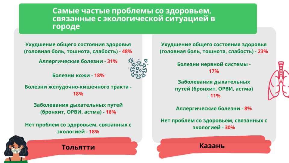
Рисунок Г.1 – Первая часть материалов инфографики