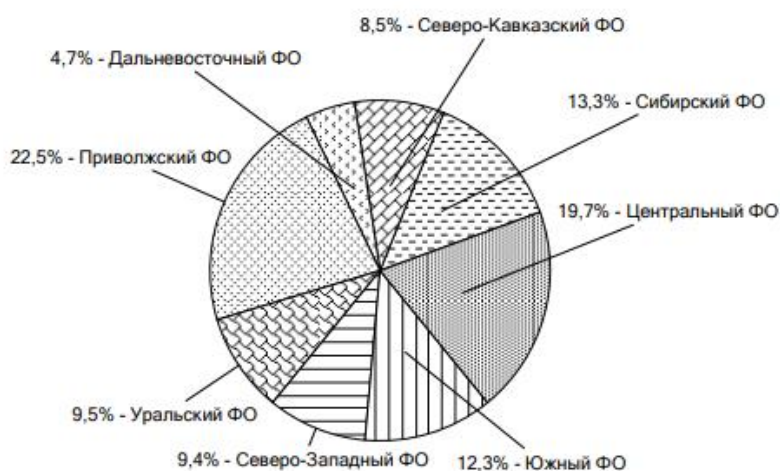
Рисунок 3. Удельный вес преступлений коррупционной направленности, зарегистрированных в федеральных округах, от их общего количества по федеральным округам Российской Федерации, %.

На рисунке 3 представлен удельный вес коррупционных преступлений, зарегистрированных по федеральным округам, от общего числа преступлений: