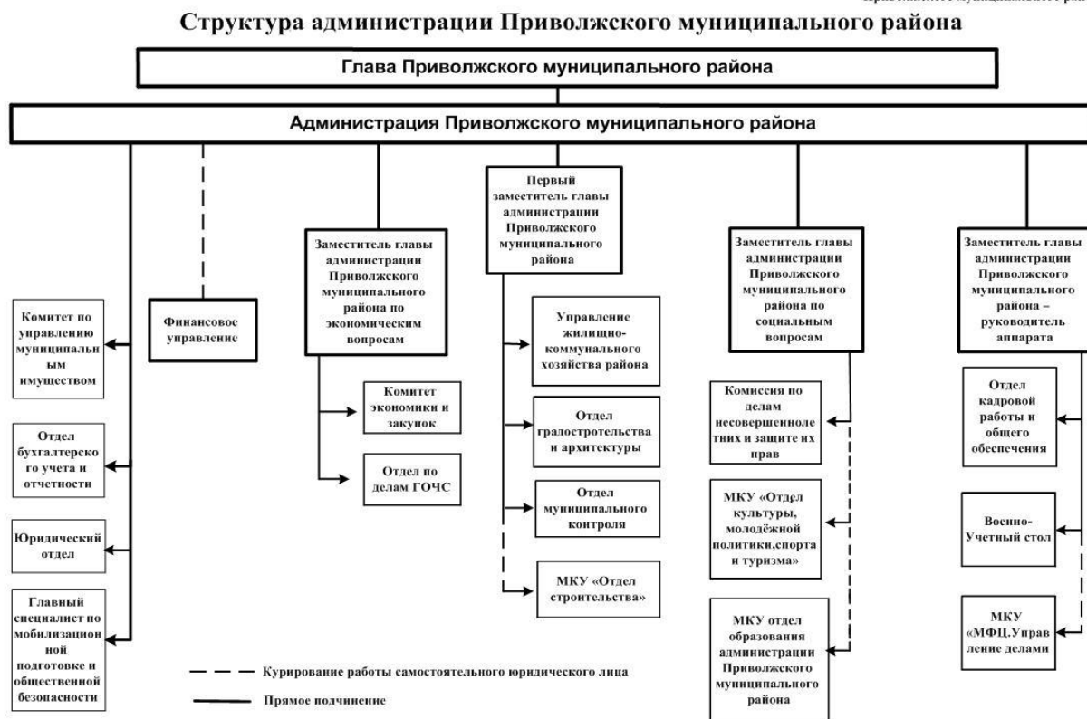
Рисунок 2 – Структура администрации Приволжского муниципального района

Администрация района обладает правами юридического лица, является муниципальным учреждением и подлежит государственной регистрации в установленном порядке.