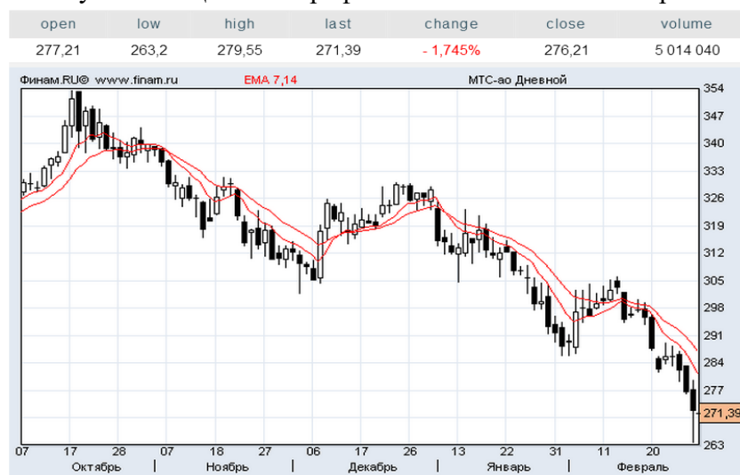
Рисунок 2 - Ценовой график ОАО «МТС»