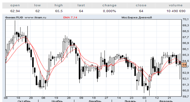
Рисунок 1 – Ценовой график ОАО «Московская Биржа»