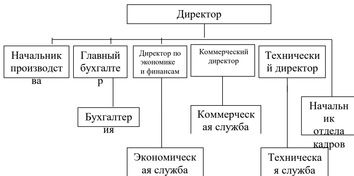
Образец организационной схемы предприятия