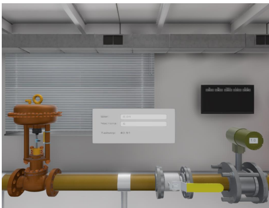
Рис.3. Панель управления регулятором.