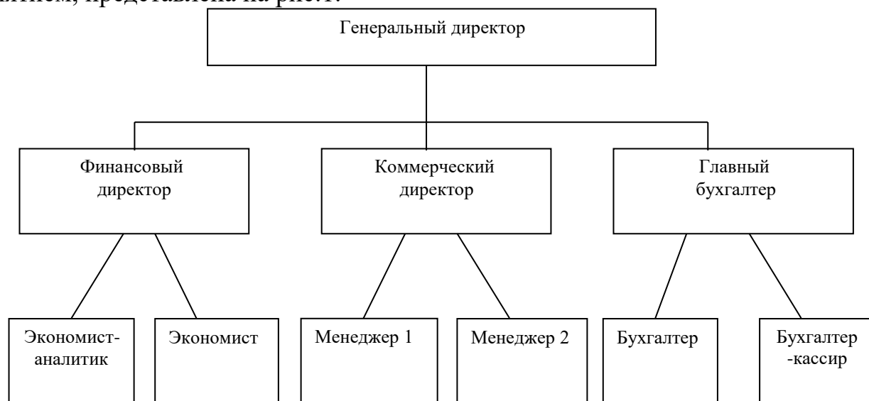
Рис. 1. Организационная структура управления предприятия

На все иллюстрации в тексте делаются ссылки - «...в соответствии с рис. 1. ...». Например, организационная структура управления предприятием, представлена на рис.1.