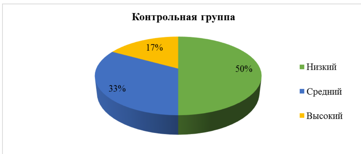
Рисунок 4 – Количественные результаты исследования контрольной группы по диагностическому заданию 2