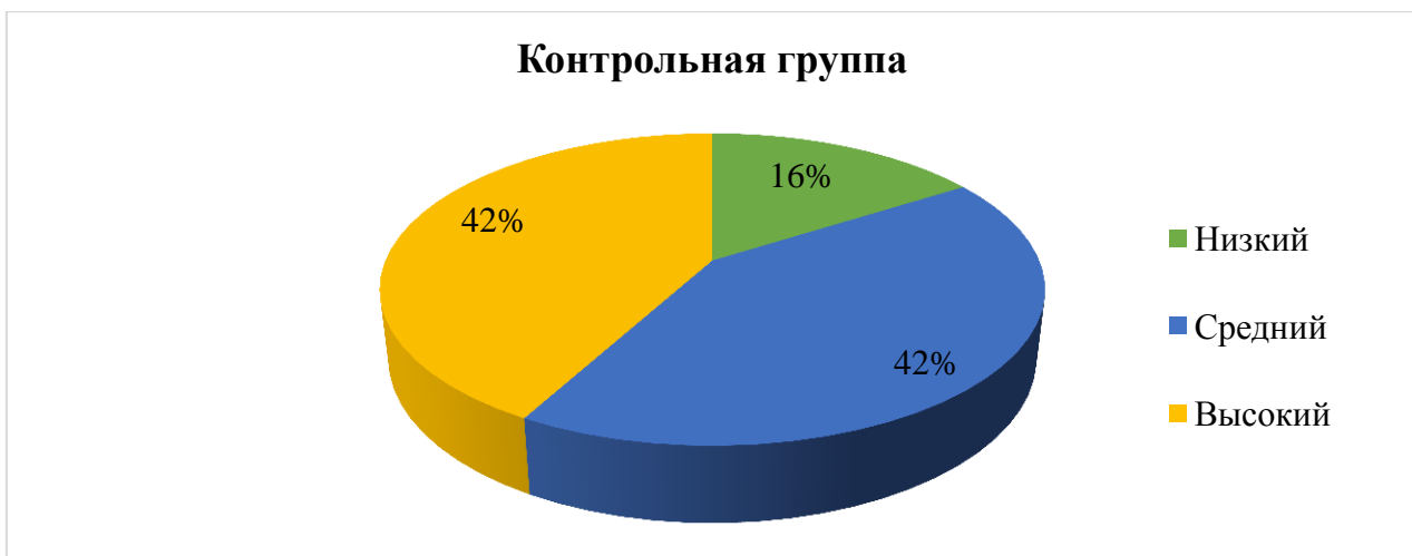
Рисунок 8 – Количественные результаты исследования контрольной группы по диагностическому заданию 4