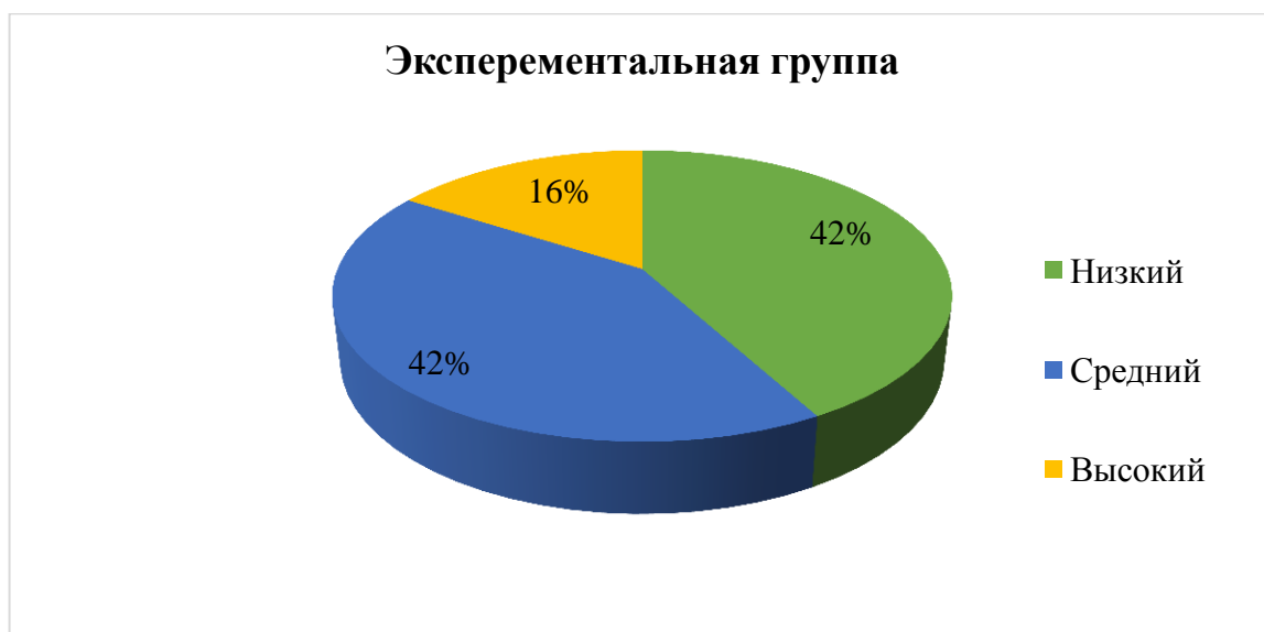
Рисунок 9 – Количественные результаты исследования экспериментальной группы по диагностическому заданию 5

Результаты, полученные в ходе проведения теста по каждой группе приведены на рисунках 9 – Результаты теста «Диагностика коммуникативного контроля» М. Шнайдера детей экспериментальной группы и 10 – Результаты теста «Диагностика коммуникативного контроля» М. Шнайдера детей контрольной группы.