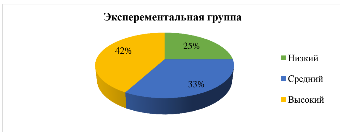
Рисунок 7 – Количественные результаты исследования экспериментальной группы по диагностическому заданию 4

Данные, полученные в ходе проведения диагностического задания «Отношение к взрослому» позволяют говорить о почти равных показателях среднего и высокого уровней сформированности умения детей взаимодействовать с взрослыми. Количественные результаты по каждой группе испытуемых детей приведены наглядно на рисунках 7 и 8.