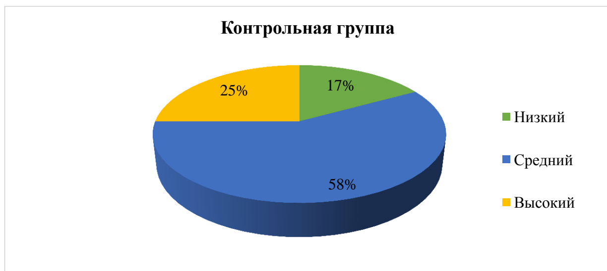
Рисунок 6 –Количественные результаты исследования контрольной группы по диагностическому заданию 3