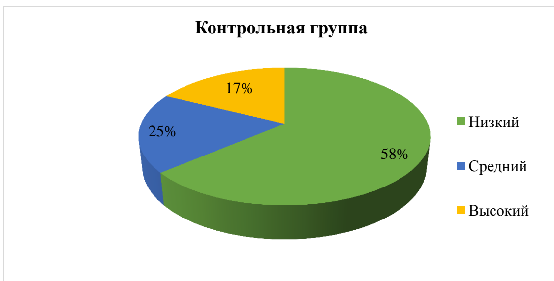
Рисунок 10 – Количественные результаты исследования контрольной группы по диагностическому заданию 5