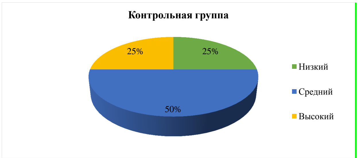
Рисунок 2 – Количественные результаты исследования контрольной группы по диагностическому заданию 1