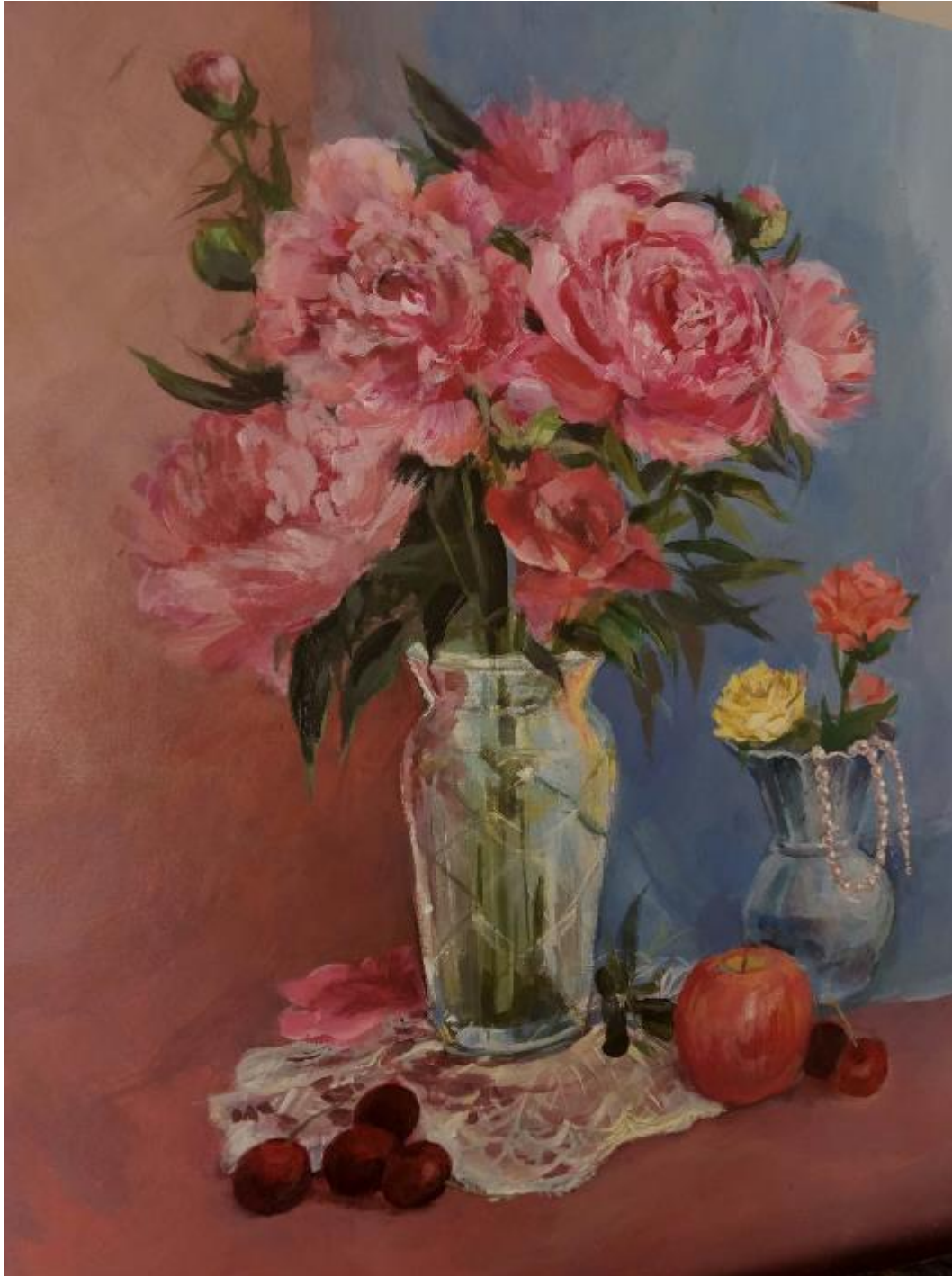
Рисунок Г.1 – Выполнение итоговой работы