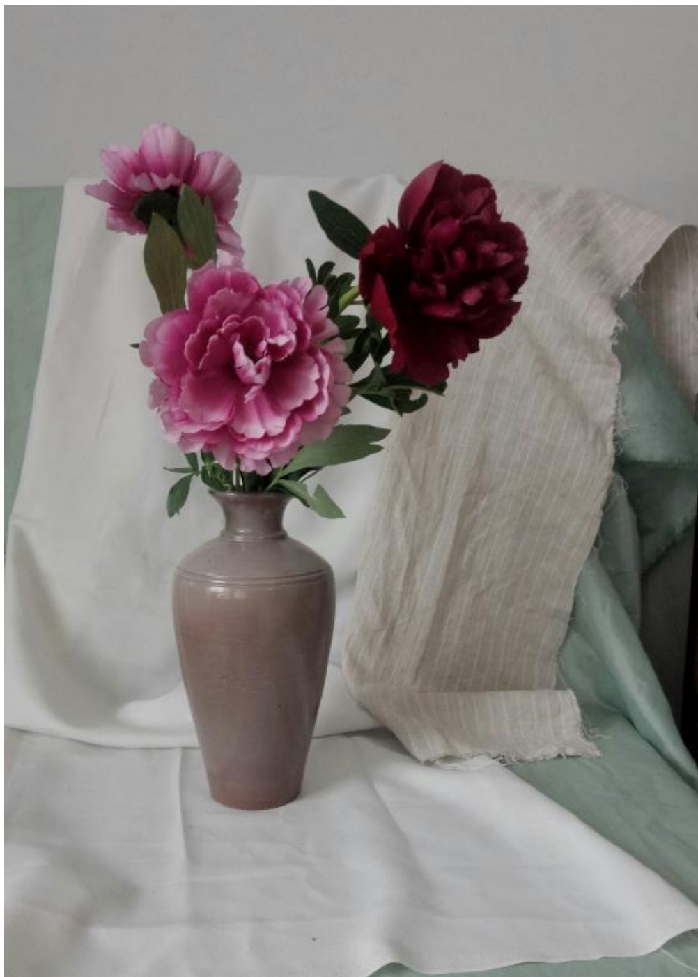
Рисунок В.2 – Выбор композиции к выполнению итоговой работы с натуры