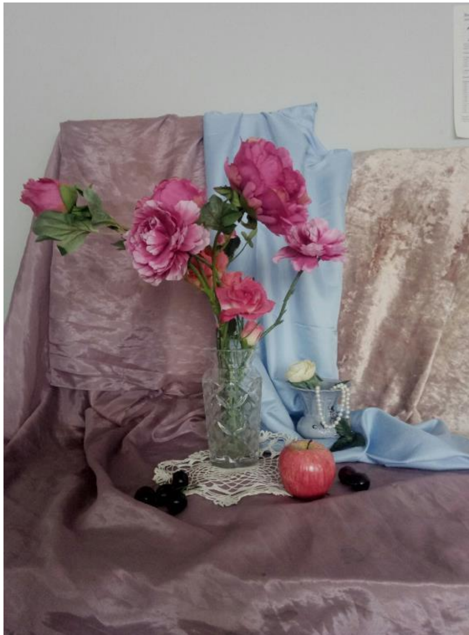
Рисунок В.1 – Выбор композиции к выполнению итоговой работы с натуры.