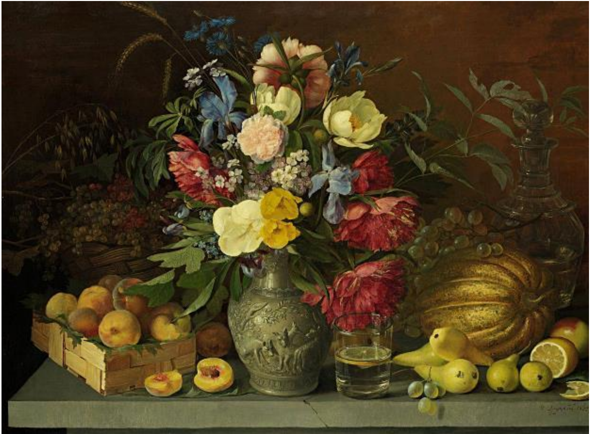
Рисунок А.6 – «Цветы и фрукты» И. Хруцкий