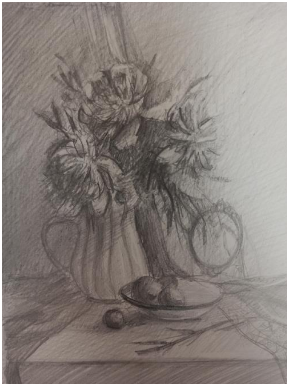
Рисунок Б.3 – Поисковый эскиз в тоне