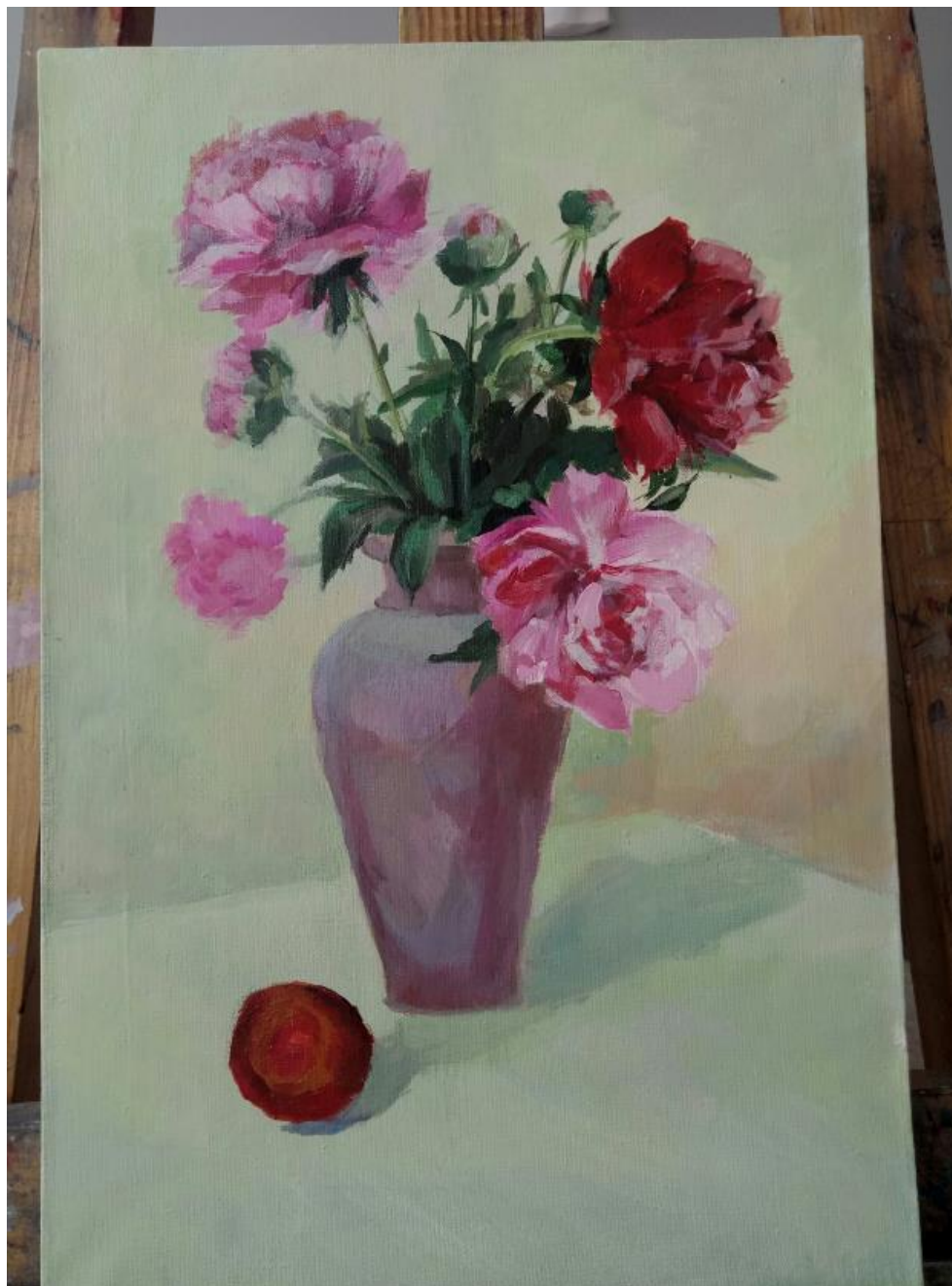
Рисунок Г.2 – Выполнение итоговой работы