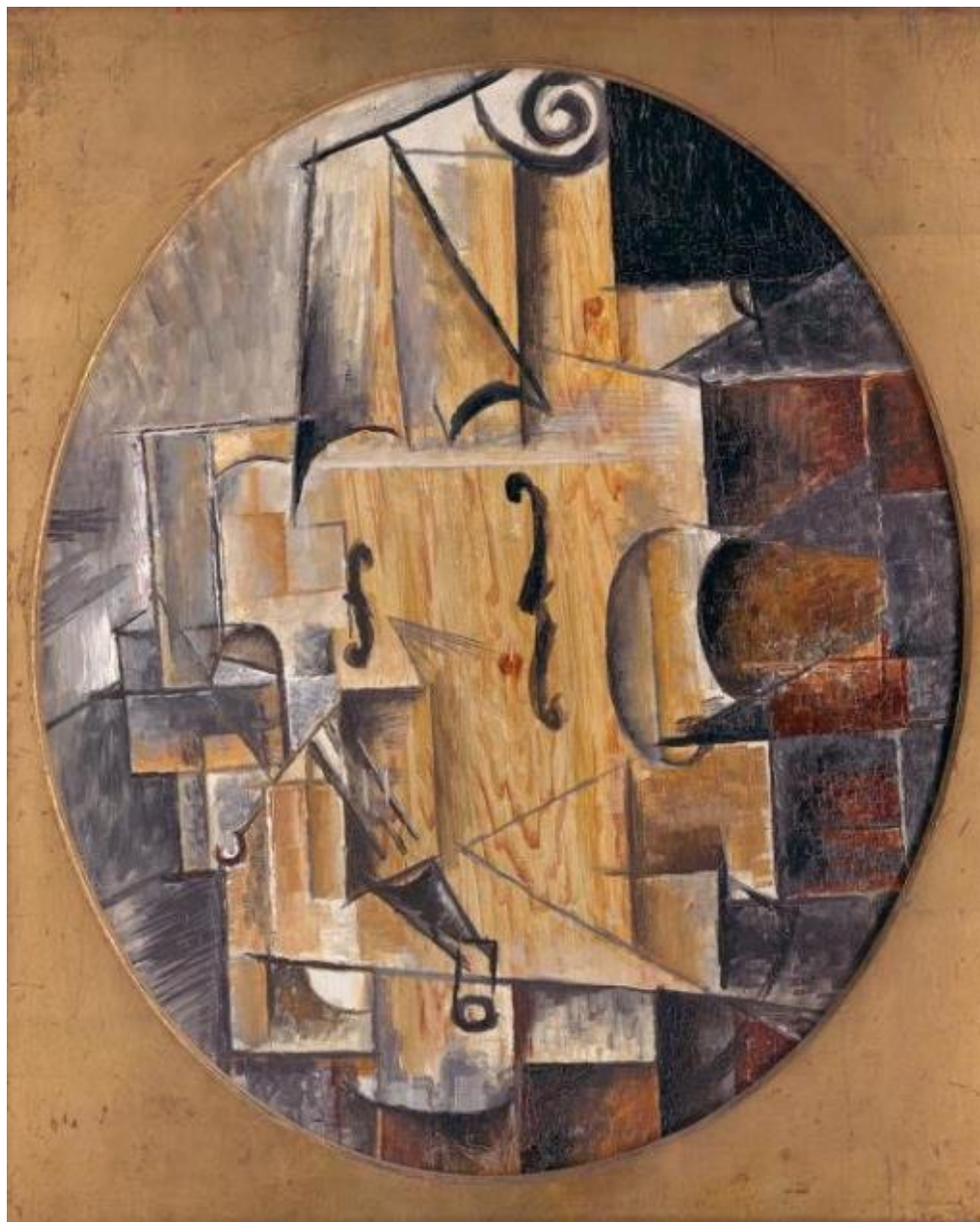
Рисунок А.2 – «Скрипка» Пабло Пикассо

Декоративный натюрморт на примере известных художников