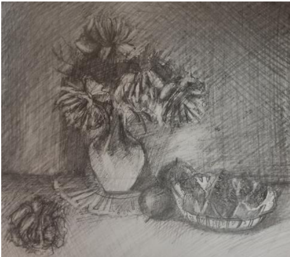
Рисунок Б.5 – Поисковый эскиз в тоне