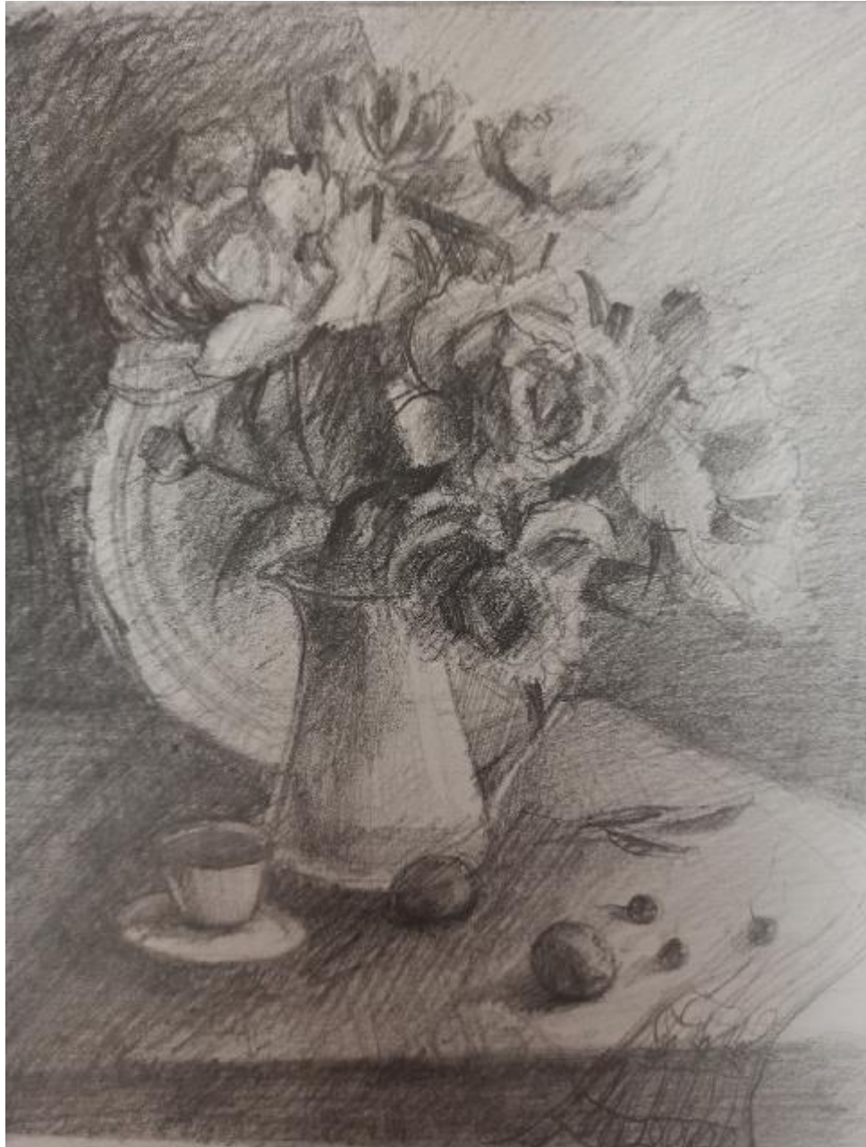
Рисунок Б.1 – Поисковый эскиз в тоне