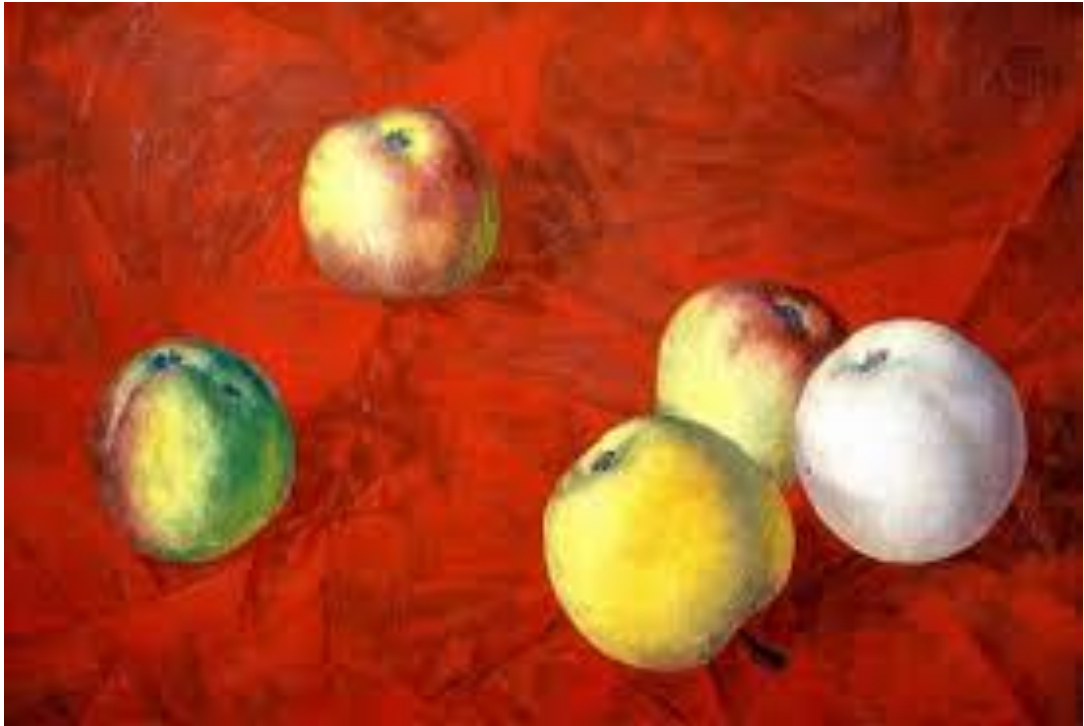
Рисунок А.5 – «Яблоки» Кузьма Сергеевич Петров-Водкин

Декоративный натюрморт на примере известных художников