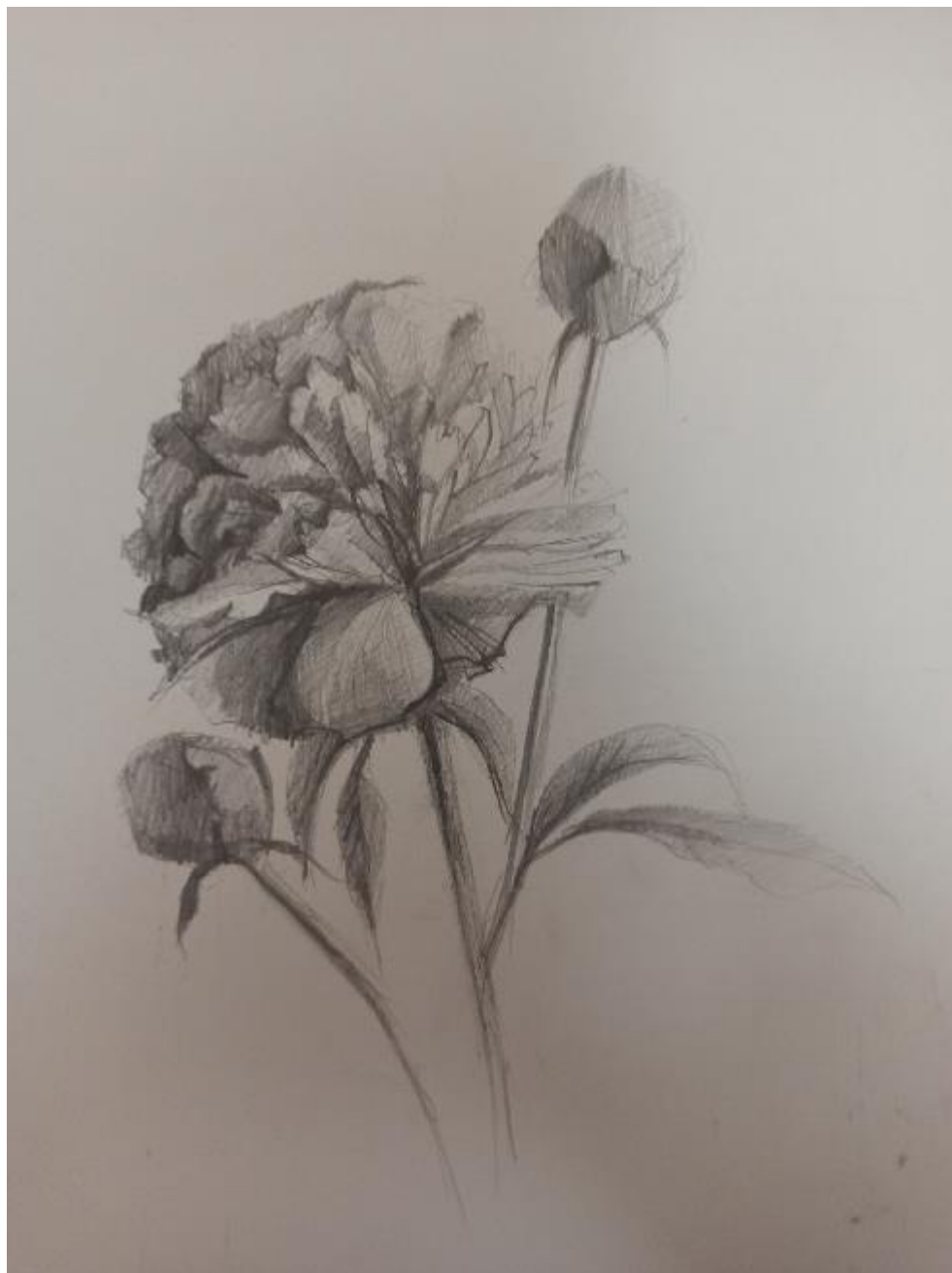
Рисунок Б.6 – Поисковый эскиз в тоне