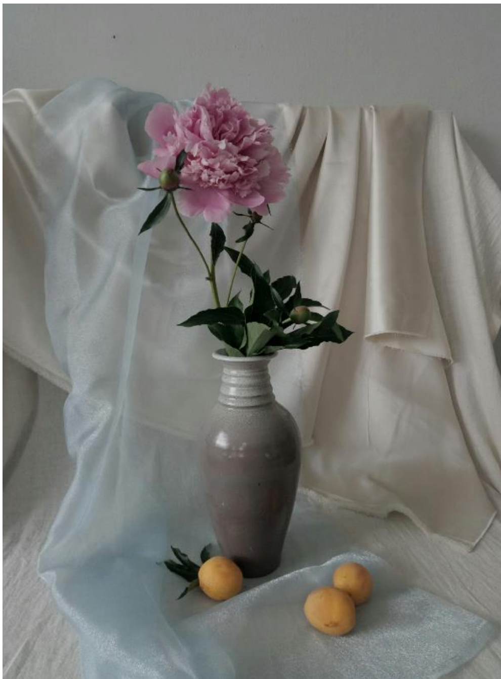
Рисунок В.3 – Выбор композиции к выполнению итоговой работы с натуры