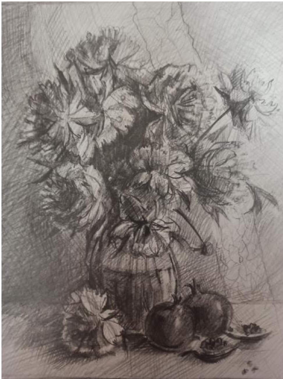
Рисунок Б.2 – Поисковый эскиз в тоне