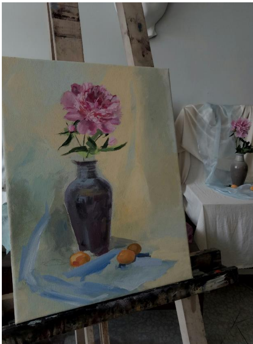
Рисунок Г.3 – Выполнение итоговой работы