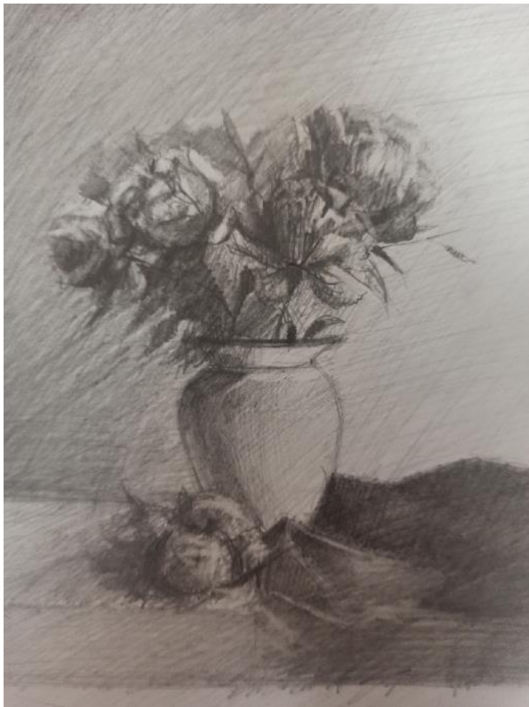
Рисунок Б.4 – Поисковый эскиз в тоне