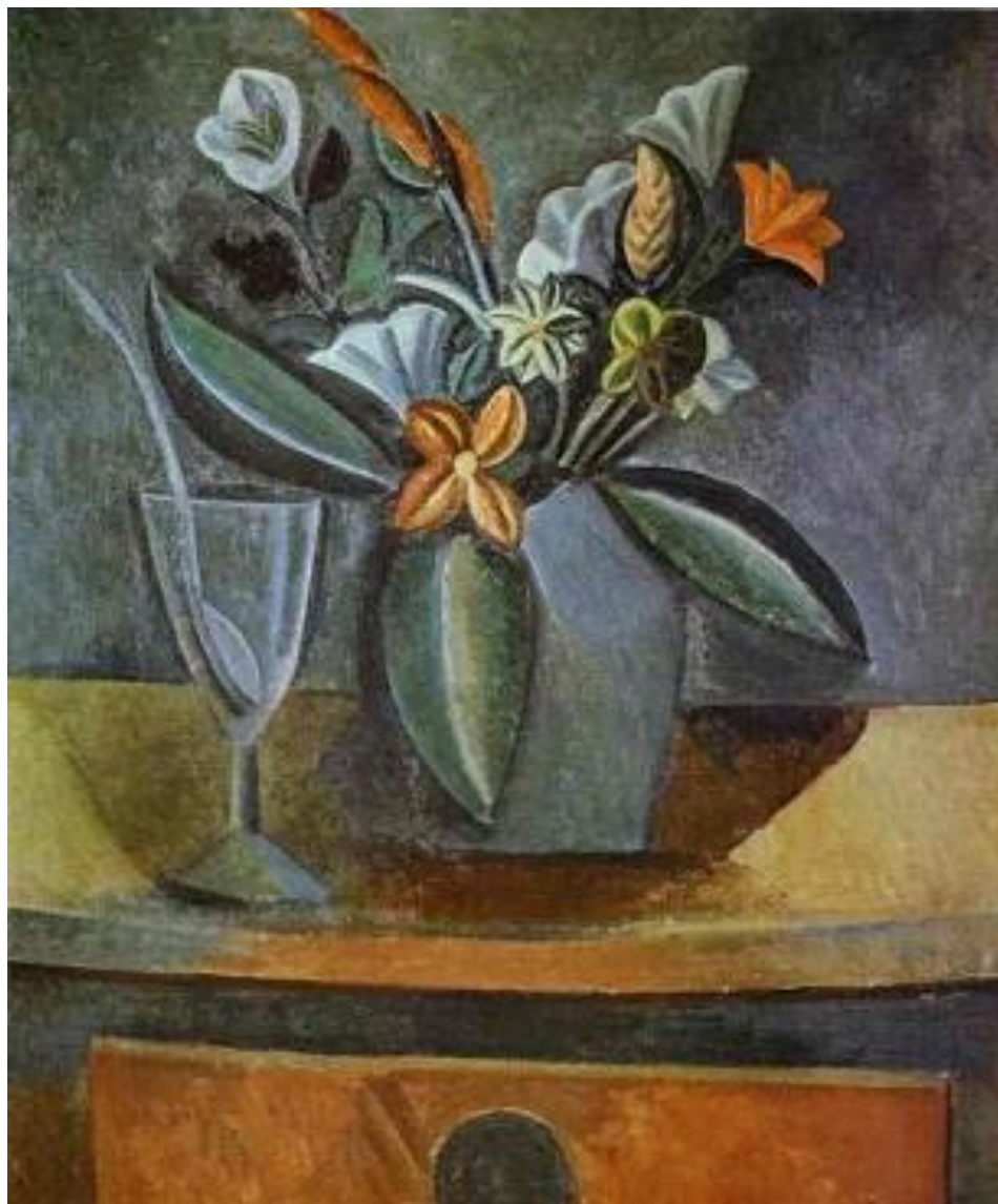
Рисунок А.3 – «Букет цветов в сером кувшине» Пабло Пикассо

Декоративный натюрморт на примере известных художников