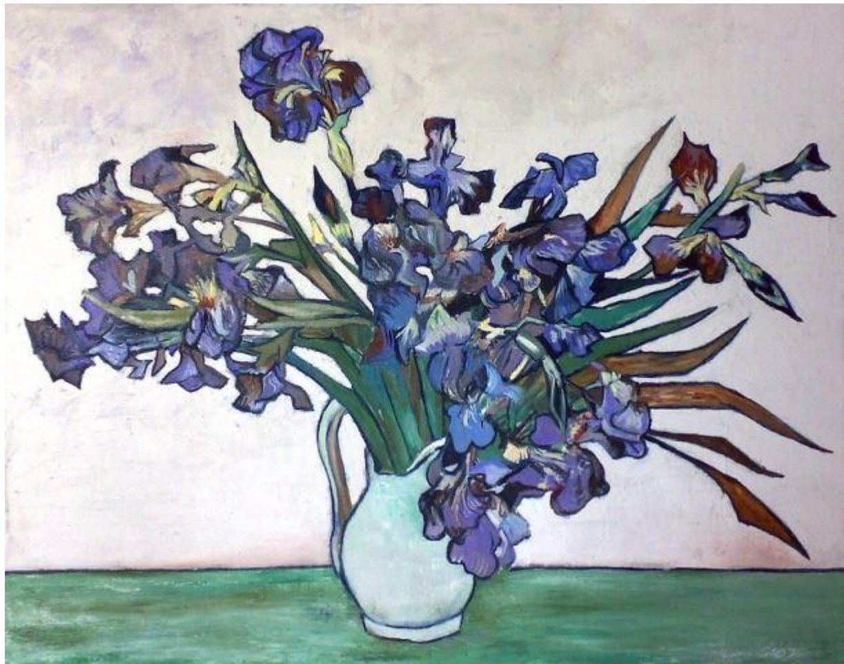
Рисунок А.1 – «Ирисы» Винсент Ван Гог

Декоративный натюрморт на примере известных художников