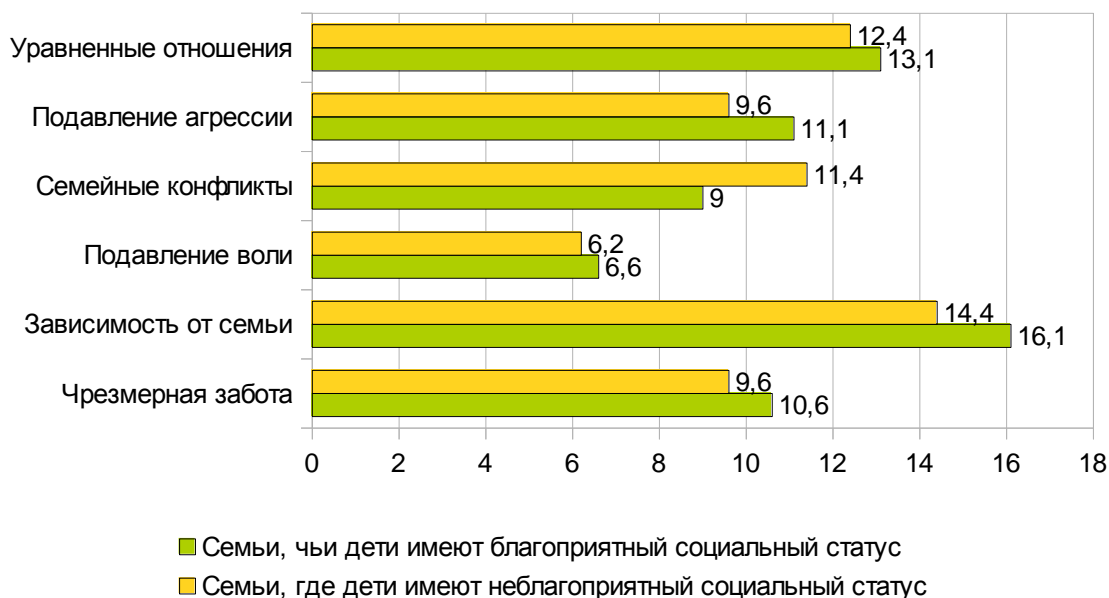
Рисунок 3. Сравнительная диаграмма средних значений показателей родительского отношения среди семей, где дети занимают разные социальные статусы.

Чтобы узнать направление данных различий также рассмотрим отдельно средние показатели среди семей, где дети занимают благоприятное и неблагоприятное статусное положение. Для большей наглядности представим данные соотношения на диаграмме.