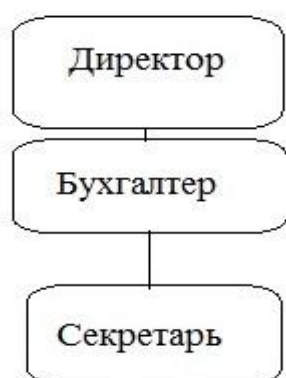
Рисунок 1 – Организационная структура организации ООО «Советник»

Организационная структура ООО «Советник» является линейной (рисунок 1).