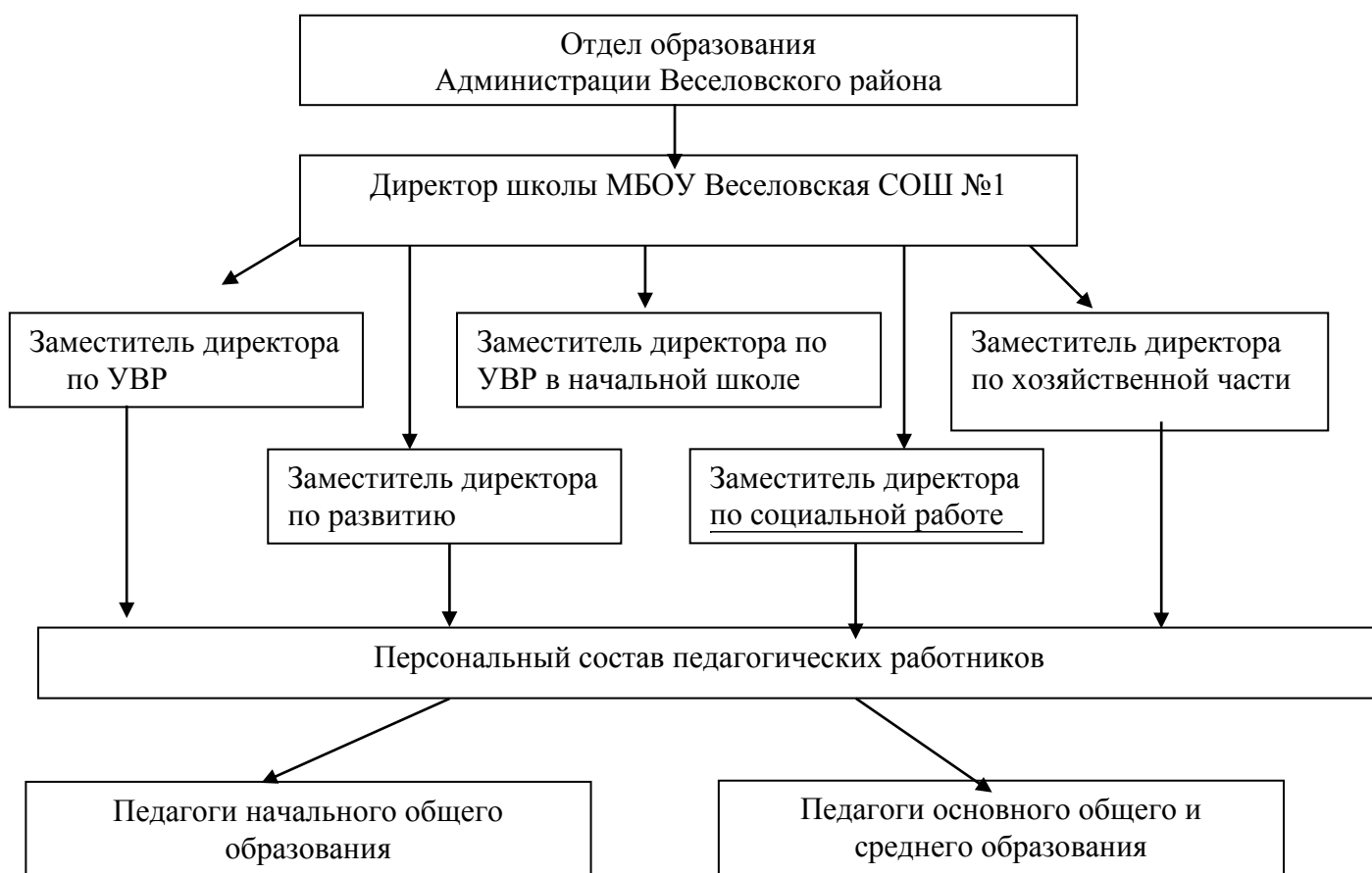
Рисунок 1 - Структура и органы управления образовательной организации

Управление Организацией показано на рисунке 1, и осуществляется на основе сочетания принципов единоначалия и коллегиальности.