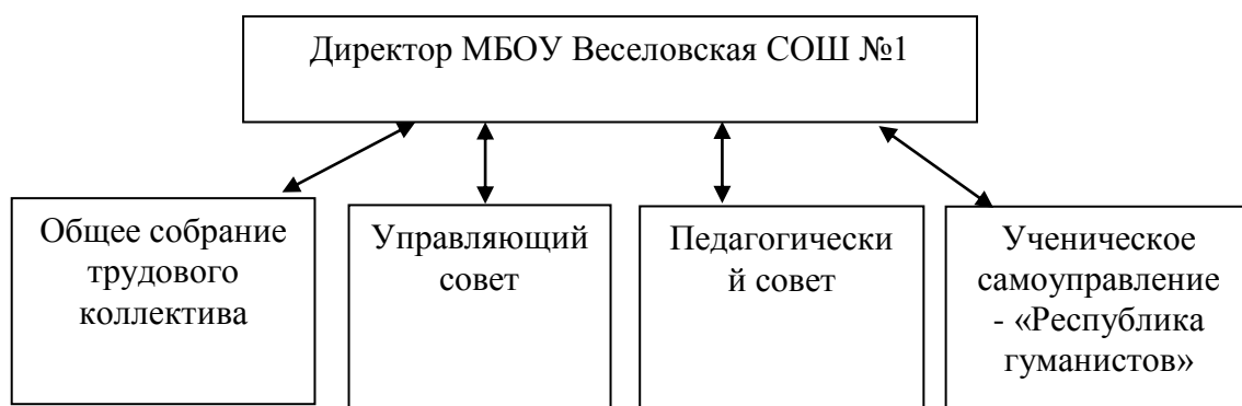
Рисунок 2 – Органы управления МБОУ Веселовская СОШ №1

Управление школой изображено на Рисунке 2 и строится на принципах единоначалия и совместного управления.